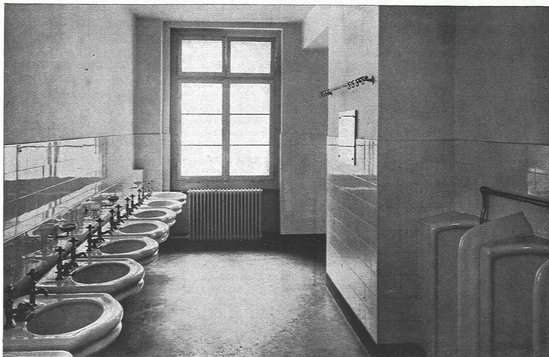
Abb. 3. Herrentoilette. Die Installation besorgte die Firma J. Rothmayr, Zürich. Die Apparate wurden geliefert von der Firma Trösch & Cie., A.-G., Zürich