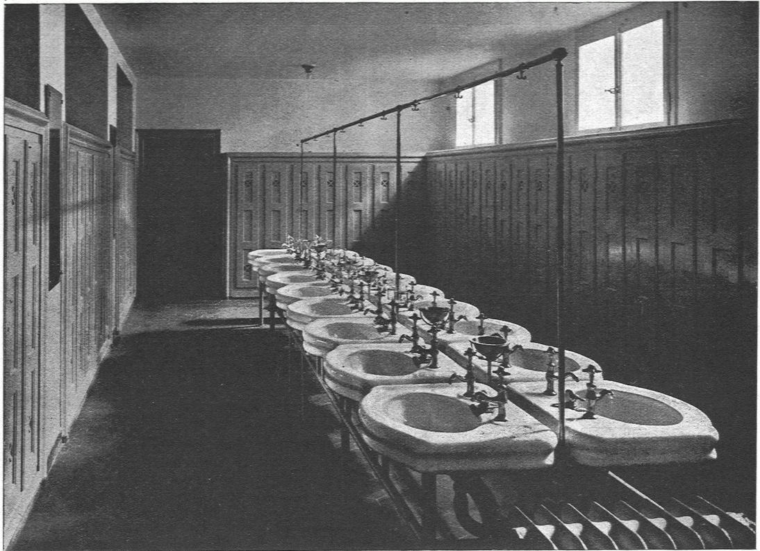
Abb. 4. Herrentoilette. Das Arrangement und die Installation besorgte die Firma J. Rothmayr, Zürich, während die Apparate von der Firma Trösch & Cie., A.-G., Zürich, geliefert wurden.