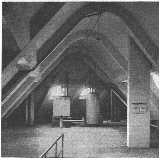
Abb. 5. Dachboden mit Niederdruck-Kaltwasserreservoir. Aufgestellt von der Firma J. Rothmayr, Zürich, und dem Expansionsgefäss der von Gebrüder Sulzer A.-G. ausgeführten Pumpen-Warmwasserheizung.

118 Feuerton-Toiletten auf weiss emaillierten Konsolen, teilweise als Reihentoiletten (Abb. 3 und 4), teilweise als Einer-Toiletten montiert. In den Direktionskabinen sind die Einer-Toiletten mit Ständermischbatterien ausgerüstet,