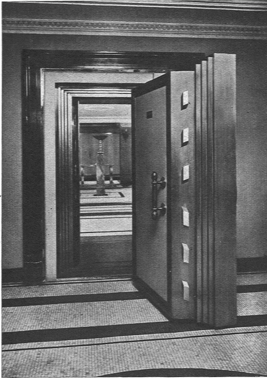
Abb. 2. Die Panzertüre zum Saferaum. Ausführung der Firma A. & R. Wiedemar, Bern.

lich, beim Öffnen und Schliessen der Beamte zugegen sein muss und damit eine Kontrolle ausüben kann. Dem Mieter ist dadurch die Gewissheit geboten, dass seine Wertsachen fachgemäss verschlossen und aufbewahrt sind. Es bleibt ihm jedoch anheimgestellt, noch weitere Verschlüsse anzubringen, sei es, dass er an den Oesen der Ueberfälle oder an der aus Weissblech bestehenden Kassette, mit welcher jedes Fach versehen ist, ein Vorhängeschloss anbringt, so dass sein der Bank anvertrautes Gut unter dreifachem Verschluss ruht.