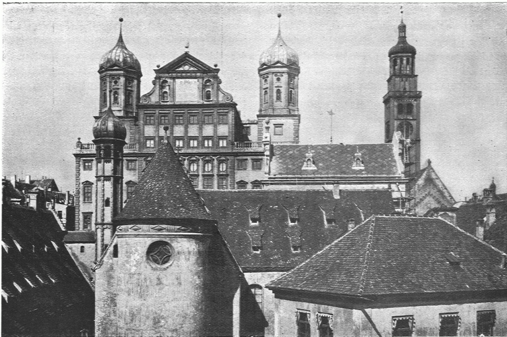
AUGSBURG / RATHAUS UND PERLACHTURM / RÜCKANSICHT