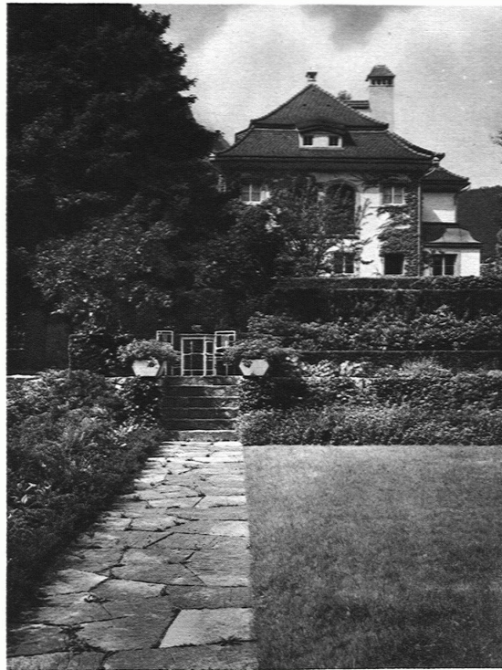
GARTEN SCHWEIZER, GLARUS Plattenweg / Das Wohnhaus vor dem Kriege erbaut durch Architekt Streiff