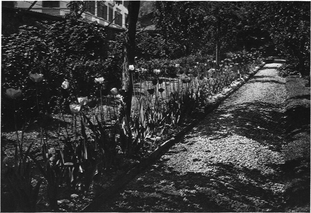
GARTEN SCHWEIZER Blumenweg

dabei dem Gelände künstlerisch über- oder unterordnet, ist eine Frage der jeweiligen Bauaufgabe.