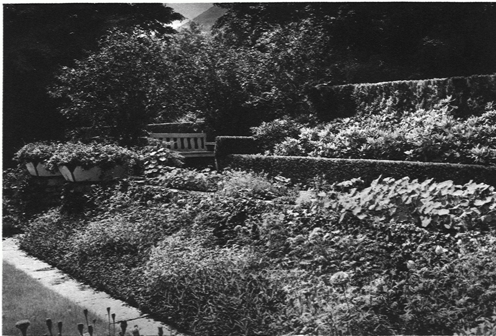
GARTEN SCHWEIZER Sitzplatz in der Südwestecke