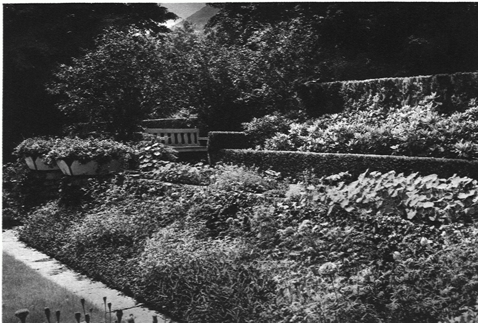
GARTEN SCHWEIZER Sitzplatz in der Südwestecke