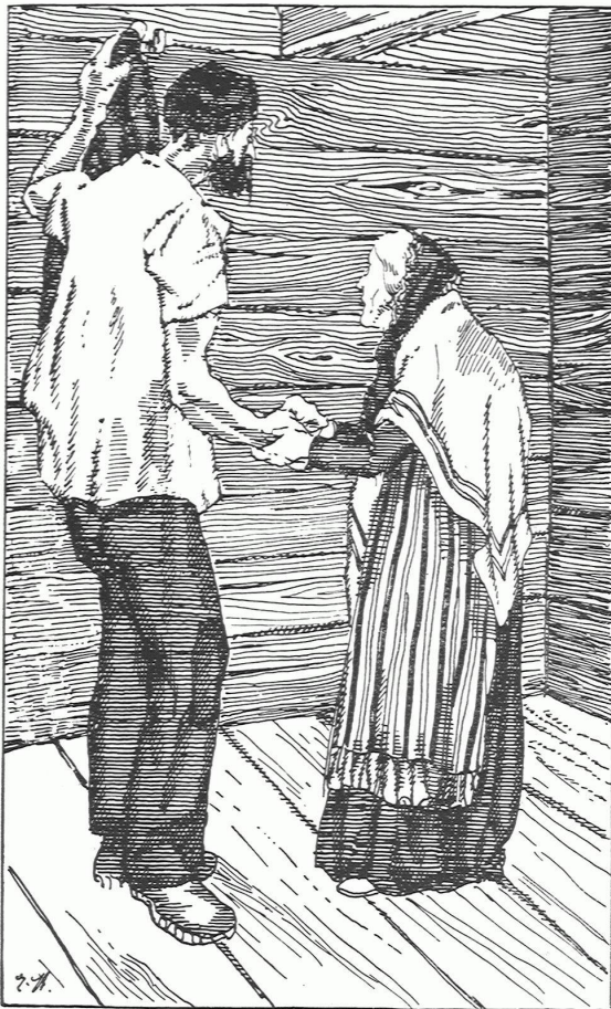
»Die Frauen von Tannö«