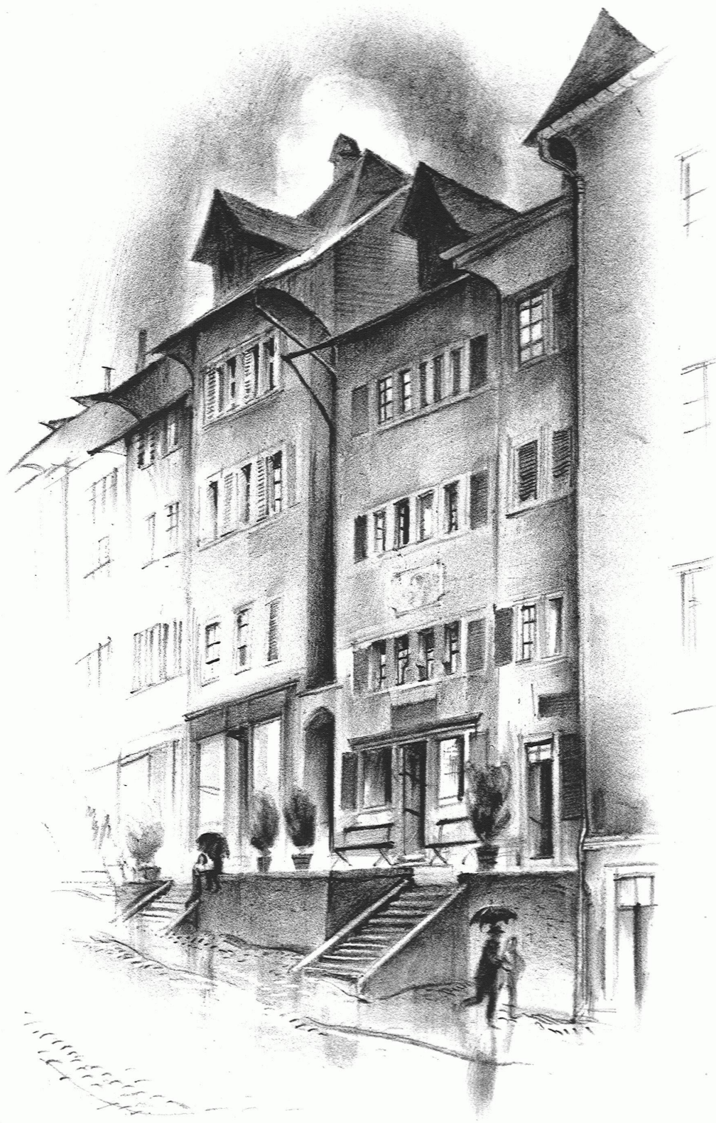
Otto Baumberger / Pestalozzi's Sterbehaus in Brugg Originallithographie aus der Mappe »Pestalozzi-Stätten«, Rotapfel-Verlag, Zürich Beilage zur Zeitschrift »Das Werk«