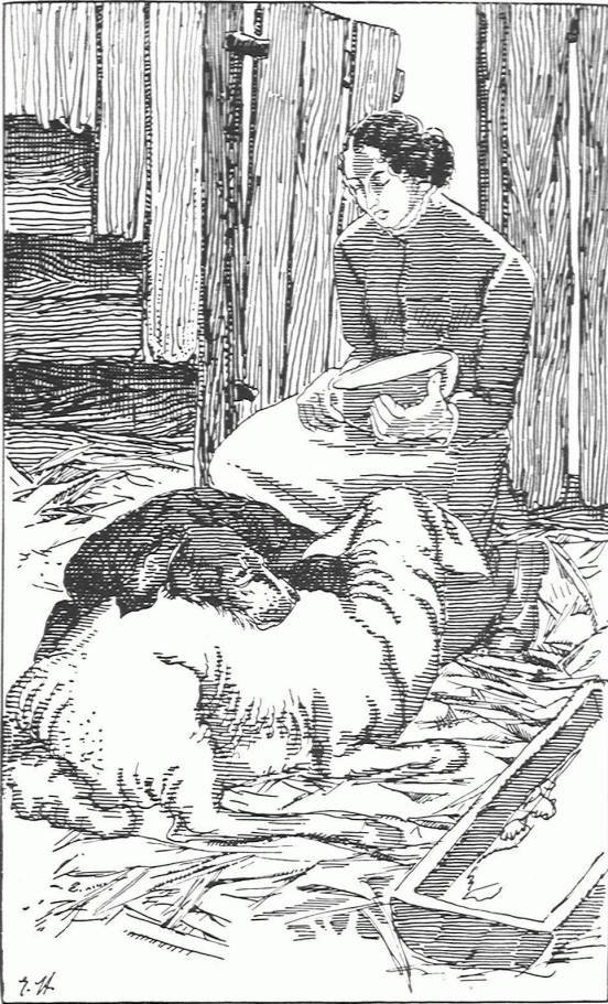
»Die Liebe des Severin Imboden«