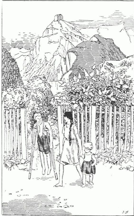
»Die Rechnung des Josef Infanger«

EDUARD STIEFEL / ILLUSTRATIONEN ZU ERNST ZAHN