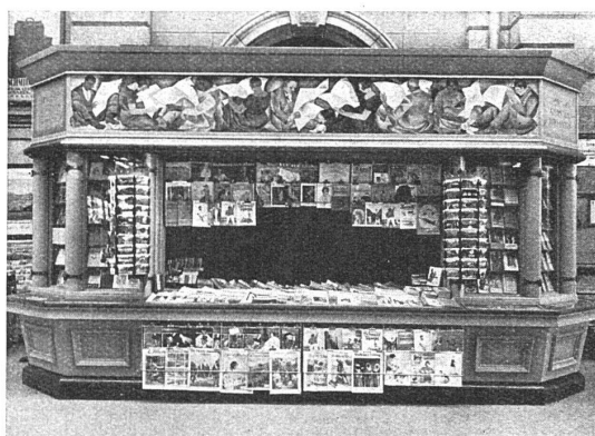
Der neue Zeitungskiosk im Bahnhof Luzern

Die Librairie-Edition S.A. vorm. F. Zahn in Bern beauftragte die Architekturfirma C. Griot u. Sohn mit der Lösung der Aufgabe. In welcher Weise dies geschehen ist, zeigt die beistehende Abbildung. Bücher und Zeitschriften in der Auslage sprechen als farbige Reklame selber. Der Farbton des Holzwerkes ist grau mit grüner Patinierung. Der farbige Fries von Kunstmaler Prof.