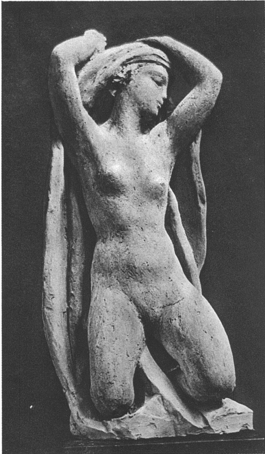
Die Nacht (Terracotta). Vom Bunde angekauft