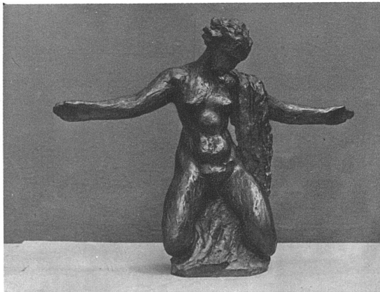
ARNOLD HÜNERWADEL, Bildhauer S.W.B., Zürich Knieende (Bronze)