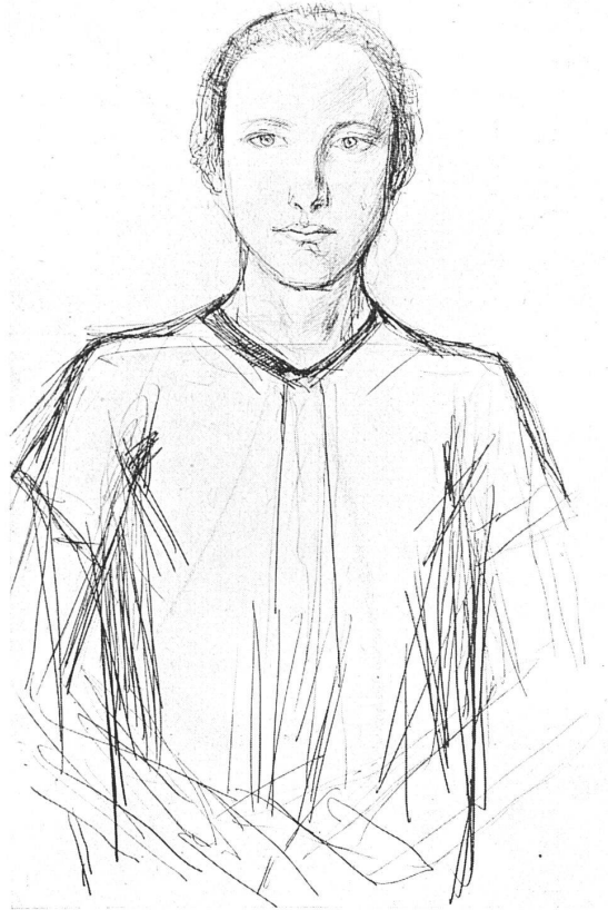
VICTOR SURBEK Mädchen / Bleistiftzeichnung