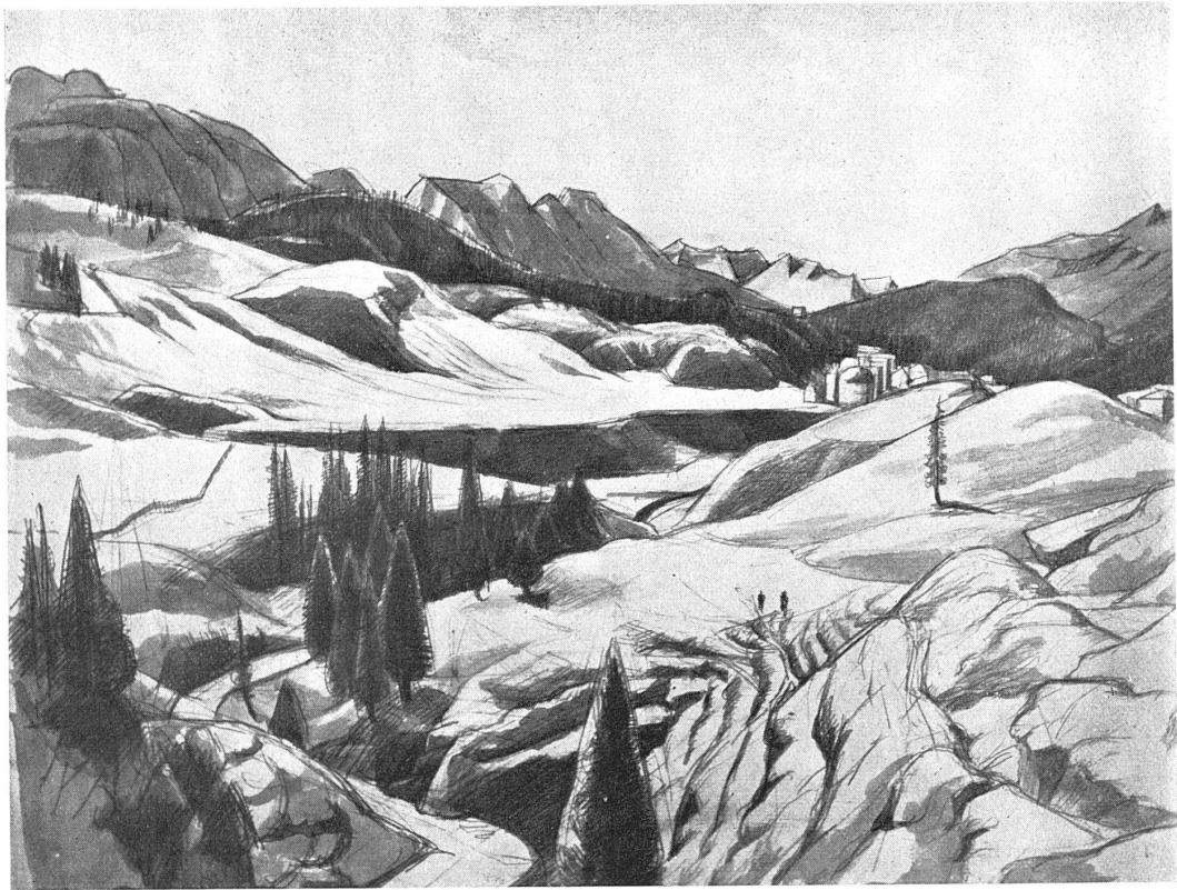
VICTOR SURBEK / S. BERNARDINO Bleistiftzeichnung, 35 × 50 cm

menschliche Figur und das Portrait mit demselben Ernst und mit demselben sichern Gelingen meistert, wie die Landschaft. Dass auch das Stilleben in den weiten Bereich seines Schaffens fällt, braucht bei des Zeichners Andacht vor jeglichem Geschaffenen kaum noch betont zu werden. — Es liegt in der Natur der Zeichnung, dass sie immer neue Formen zur Darstellung bringen will. Und jede neue Form, jedes neue Motiv verlangt neue Ausdrucksmittel. Surbek besitzt ein ungewöhnlich feines Gefühl für das »Wie« der Darstellung. Er weiss mit untrüglicher Sicherheit jeden Vorwurf seinem Wesen gemäss zu gestalten, sei es, dass er ihn rein zeichnerisch behandelt, sei es, dass er ihn durch Tonflächen oder durch farbige Tönung seinem Charakter entsprechend wiedergibt. So entsteht neben dem erquicklichen Reichtum an Motiven eine muntere Abwechslung in der Darstellungsart, die Surbeks Blätter alle als individuell gestaltete Schöpfungen erscheinen lässt. Darum besitzen sie auch den grossen und wichtigen Vorzug, nie langweilig zu sein.