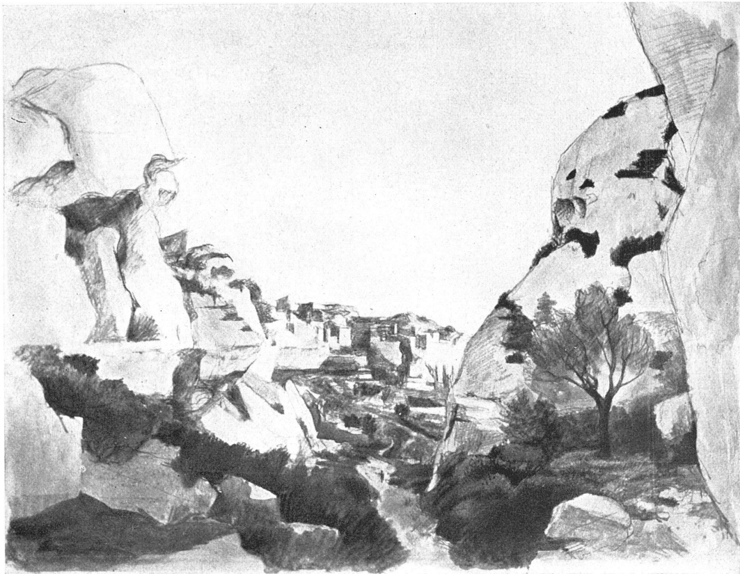
VICTOR SURBEK / LES BAUX (PROVENCE) Aquarell, 32 × 40 cm

Darstellungsart fallen, wir werden im Gegenteil das Landschaftsbild als Ganzes in uns eindr.ngen lassen. Woran liegt das?