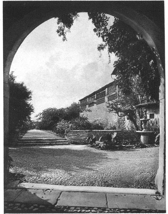
Blick aus dem Hof auf den obern Weg

ein Feld von ungefähr 8000 m 2 Fläche, das nach Auflassung mehrerer Wegrechte und Servitute der gärtnerischen Bebauung freistand (siehe den Situationsplan). Die Elemente der planmässigen Aufteilung sind im wesentlichen folgende: ein in der Längsrichtung durchgeführter Weg teilt das Gelände in zwei ungleiche Hälften, die ihrerseits wieder durch einen rechtwinklig zum ersten angelegten Querweg unterteilt werden. Im Schnittpunkt der beiden Wege steht die grosse Pergola und das Badebassin. Von den beiden kleineren Kompartimenten zunächst den Oekonomiegebäuden (Nordseite) wurde das erste im wesentlichen für Beete und Rabatten, das zweite für den Tennisplatz reserviert. Ein breiter, abwechselnd von Allee-Bäumen und immergrünen Büschen eingefasster Weg führt vom Herrenhaus her an den Oekonomiegebäuden vorbei zum Tennisplatz; er bezeichnet die höchste Stelle im Garten, da von ihm aus das Gelände zum Oglio hin leicht abfällt. Die beiden andern Kompartimente sind der sehr grosse «Brolo», eine freie, mit wenigen Bäumen bestandene Wiese, und dahinter der Gemüsegarten. Im Blickpunkt des mittleren Längsweges steht das ebenfalls von Froebel neu gebaute Tennishaus, und hart am Rande des Oglioabhanges führt ein Weg