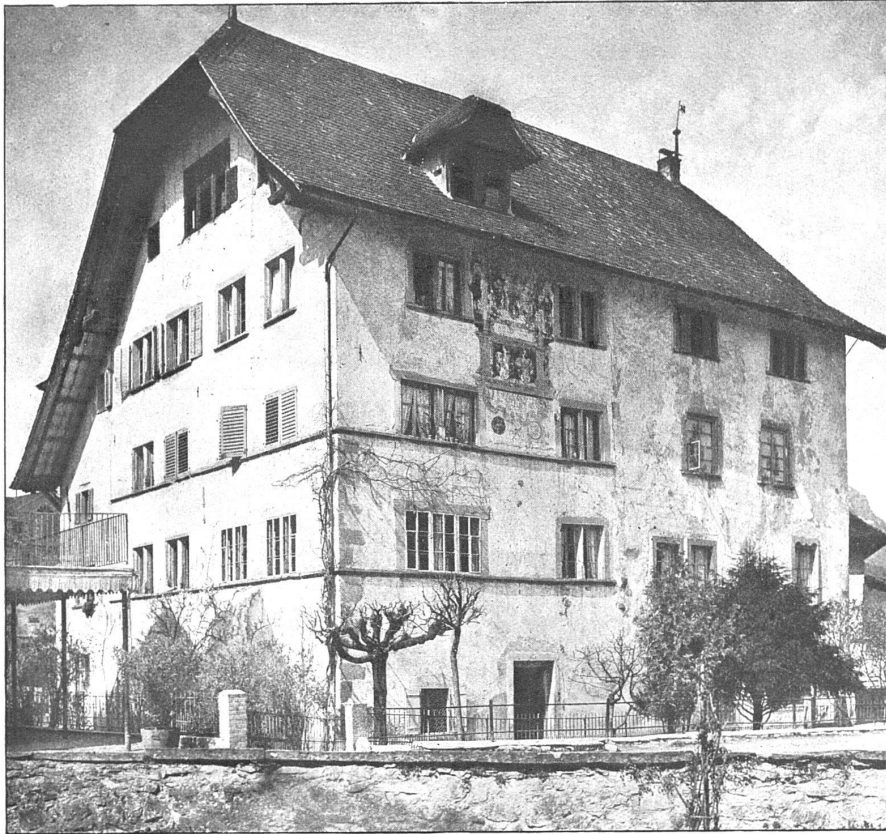
DIE ROSENBURG IN STANS