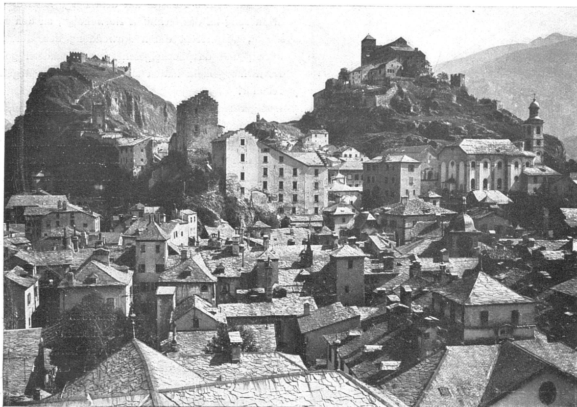
SITTEN / DIE STADT VON DER KATHEDRALE AUS Aus Jos. Gantner, Die Schweizerstadt / R. Piper & Co., München