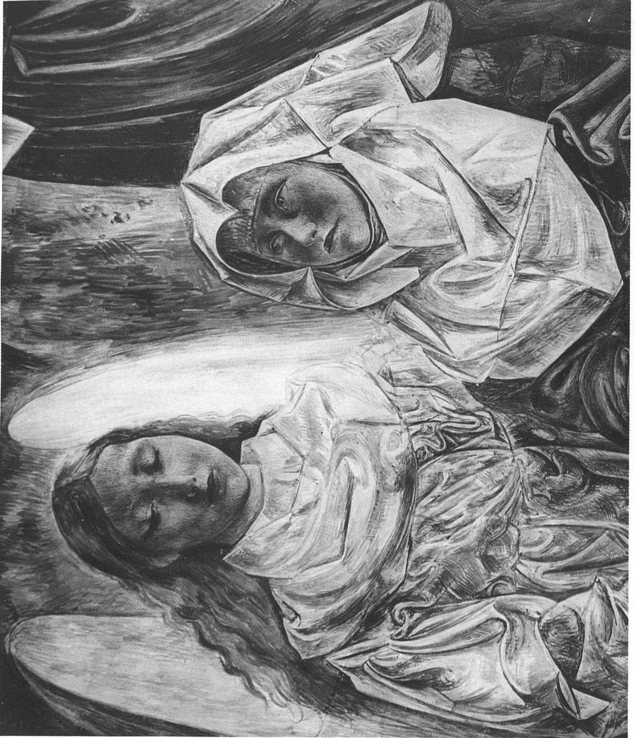
PAUL BODMER 7 FRESKEN IM FRAUMÜNSTER- DURCHGANG, ZÜRICH