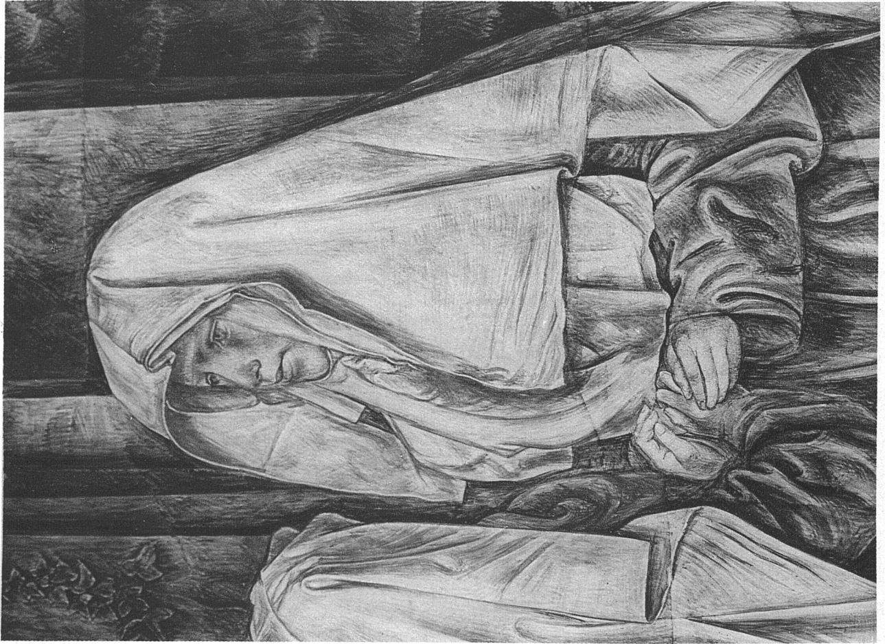
PAUL BODMER / FRESKEN IM FRAUMÜNSTER-DURCHGANG, ZÜRICH