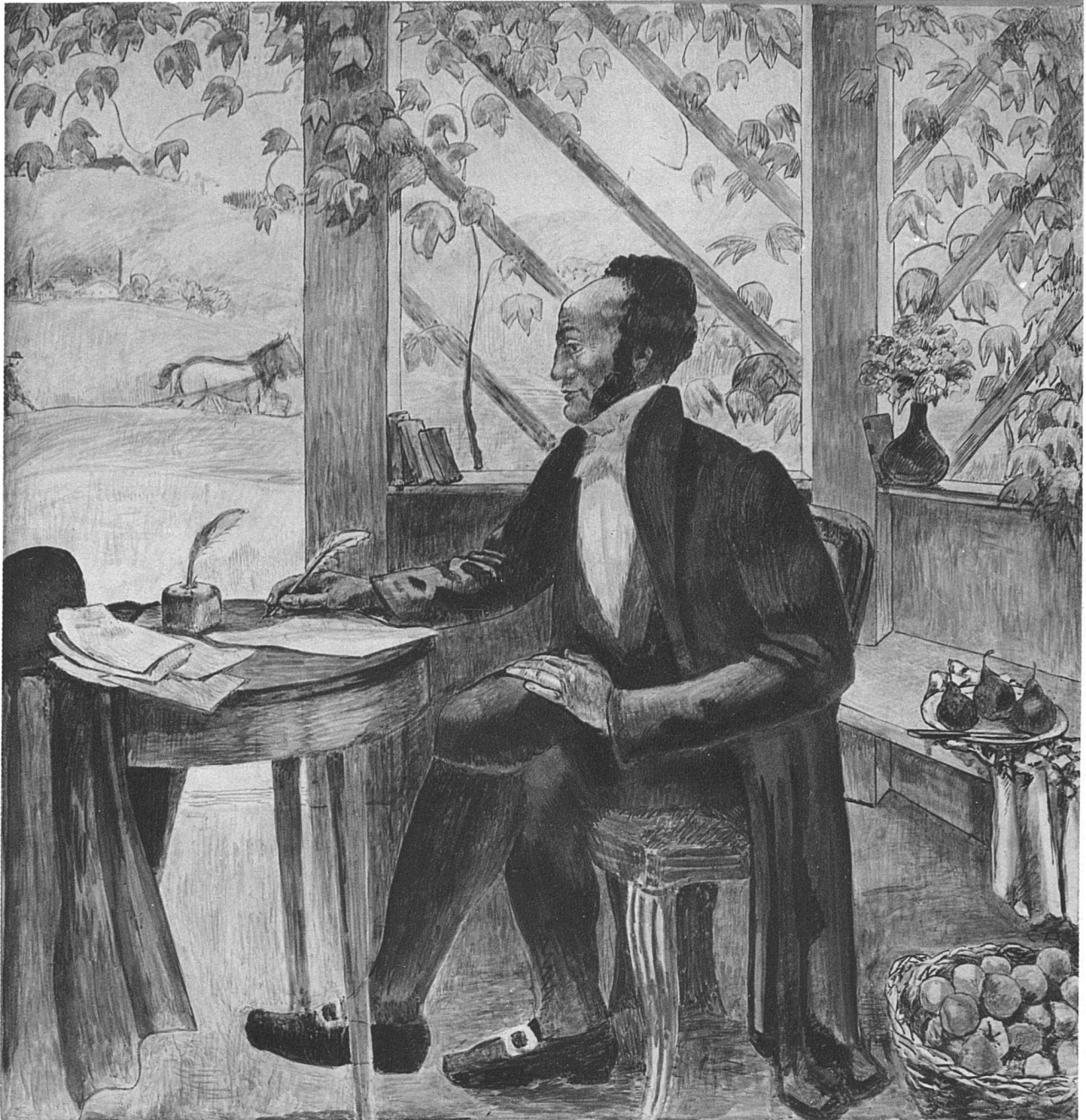
CUNO AMIET / JEREMIAS GOTTHELF

in der Hand, in der herbstlich durchsonnten Laube seines pfarrherrlichen Gartens. Der Duft der reifen Früchte, einer satten, abendwarmen Erde steigt aus allen Poren des reich variierten Rot und durchsickert das ganze Bild als vibrierende Wärme eines golden verräuschten Tages. Die Laube öffnet sich gegen das weite Feld und die sanften Hügel des Emmentals.