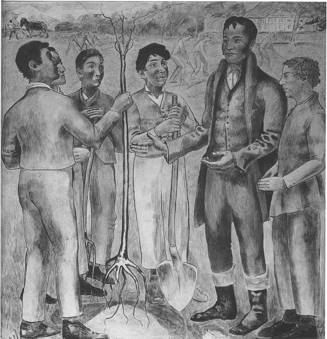
CUNC AMIET / FELLENBERG

— ist von einer so schönen, sonntäglichen Farbigeit, dass es wie eine bildgewordene Szene aus Gottfried Keller erscheint. Amiet scheint hier den Kern seines Wesens getroffen zu haben, das ähnlich wie bei Keller, bei aller Fähigkeit rein künstlerischer Gestaltung, sich immer an den Erscheinungen der Wirklichkeit bis zu den Properheiten des bürgerlichen Alltags hinunter nährt und erfreut. Das vierte Bild zeigt den Erzieher Fellenberg. Er steht inmitten einiger Zöglinge seiner Anstalt,