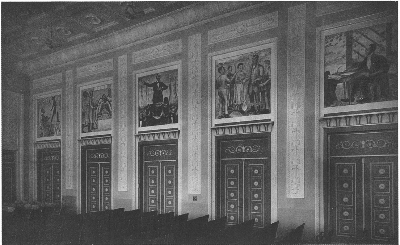
AULA DES NEUEN GYMNASIUMS IN BERN / ARCHITEKTEN BRACHER UND WIDMER