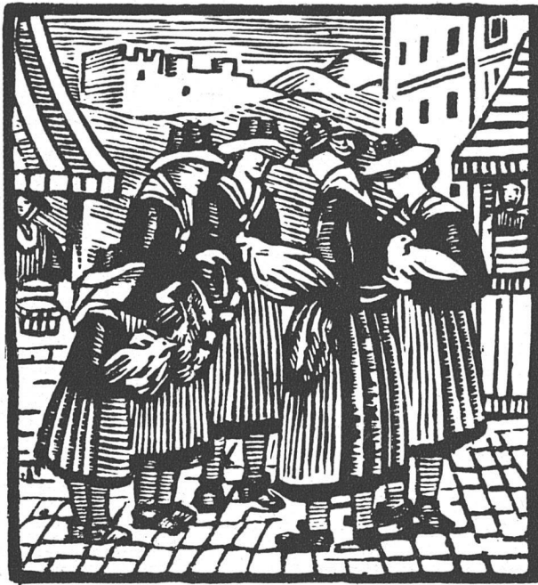
HANNA PFLÜGER, BASEL / HOLZSCHNITTE / 13 × 14 cm

cutés par des jeunes filles dans une école d'apprentissage. Ce qu'on pouvait apprendre en regardant s'augmentait de ce qu'on pouvait apprendre en écoutant. L'admiration des élèves et de leur mère, allait aux travaux absurdes, aux coussins de satin pailletés, ou décorés de figures peintes. Elle allait aux broderies simulant des peintures, reproduisant au naturel des fleurs dans un verre d'eau! Toute la sottise des esprits faux s'offrait aux regards excités des parents et des élèves, cependant qu'à côté, sur une petite table, des pièces rapportées, des reprises, des stoppages, témoignaient d'une si tendre humilité, d'une telle perfection manuelle, d'un tel accord des moyens et du but que ces humbles choses toutes chargées d'humanité devenaient bien plus émouvantes que les soies, les satins, les velours, les ors et les dentelles qui vaniteusement les entouraient.