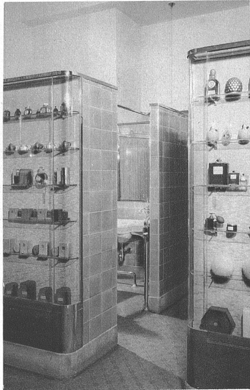
Coiffeurgeschäft Bachmann an der Poststrasse, Zürich Arch. J. Graf, Niederurnen (Glarus)