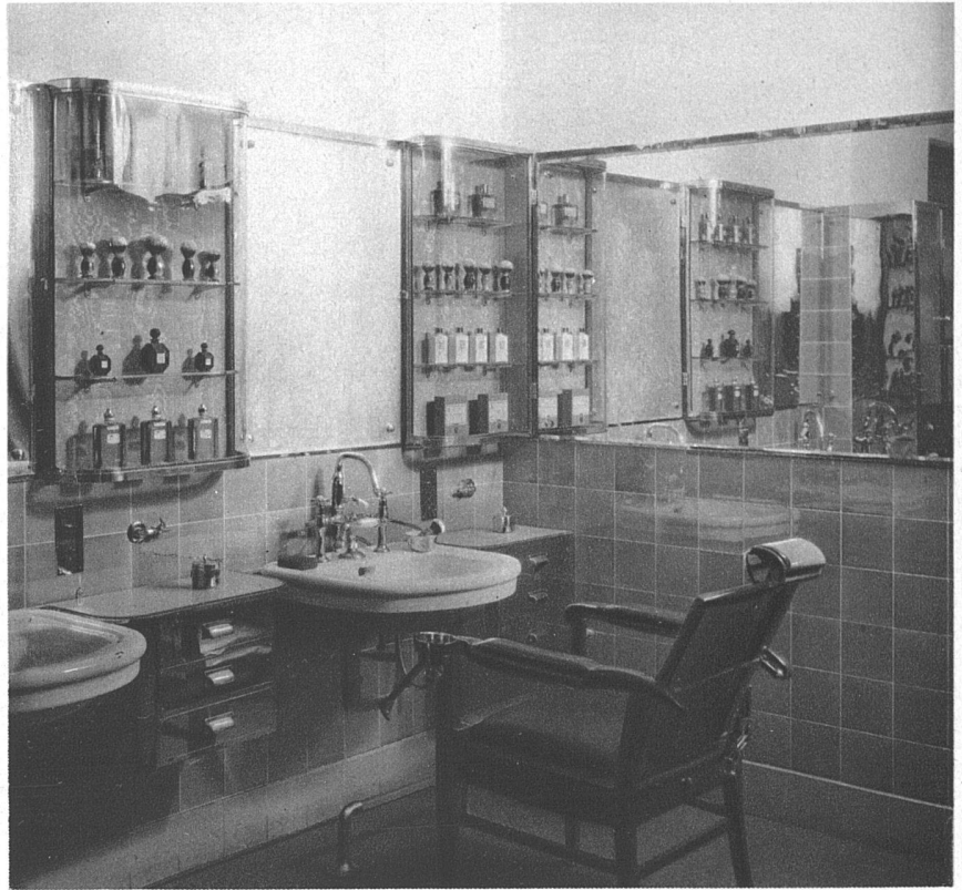
Coiffeurgeschäft Bachmann, Zürich Arch. J. Graf, Niederurnen (Glarus)