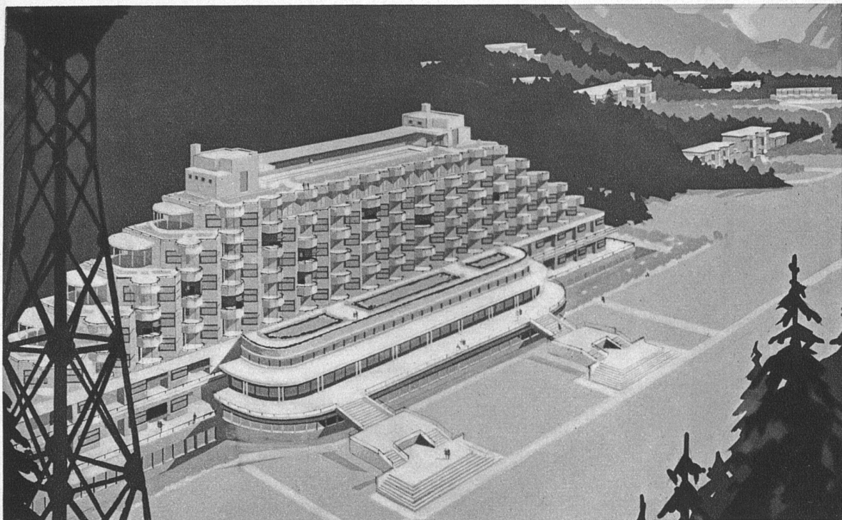
Lungenheilstalt Plaine-Joux-Mont-Blanc (im Bau) Architekten Pol Abraham und Henry Le Môme oben: Ansicht der Gesamtanlage mit den Einzelpavillons unten: Grundriss eines Appartements

Das hier abgebildete Hauptgebäude enthält 120, sämtlich nach Süden gerichtete Krankenzimmer mit Einzel-Liegebalkon; die Gliederung der Südfassade ergibt sich aus dem Grundriss der Einzelzimmer, für die möglichst