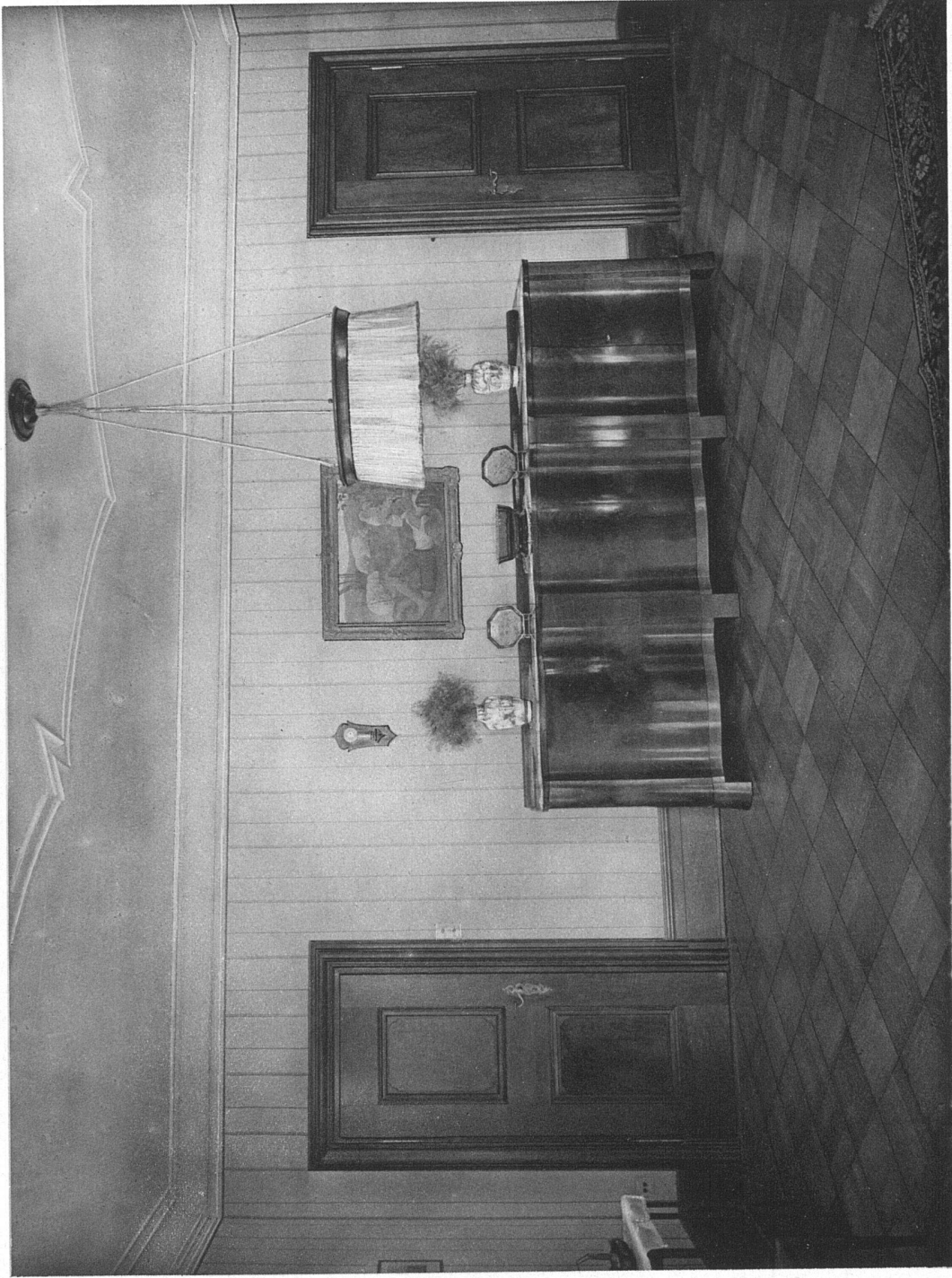
Esszimmer in Nussbaumholz

ALFRED HÄCHLER S.W.B. • SCHREINEREI-WERKSTÄTTEN • LENZBURG