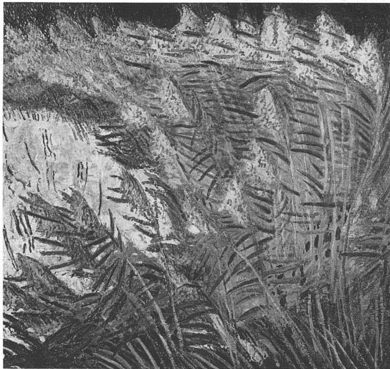
Teich Oel 1930 79×74 cm