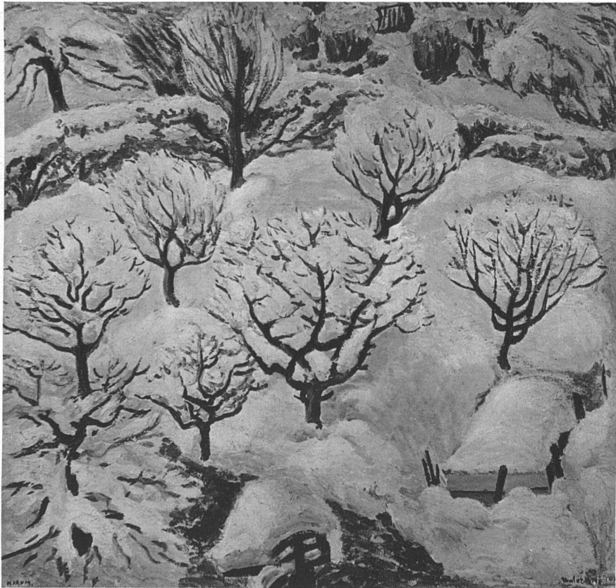
Aprilschnee Oel 1929 79×74 cm