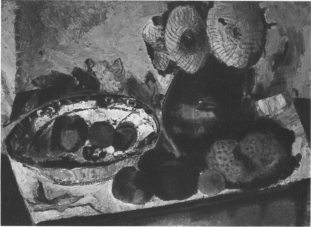
Helen Dahm, Oetwil Äpfel und Sonnenblumen Oel 1928 75 × 55 cm