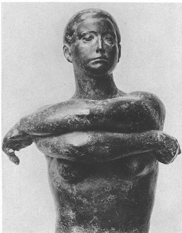
Anna M. Schindler, Glarus «Schreitende», Bronze