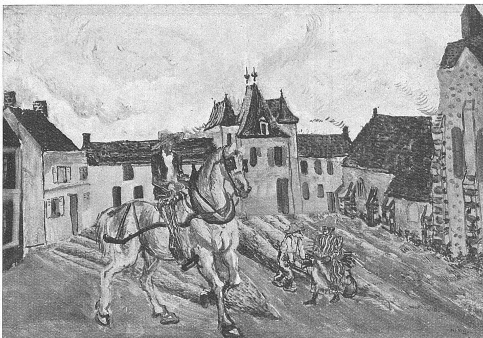
Per Krohg, Paris aus der Ausstellung im Kunstsalon Forter, Zürich