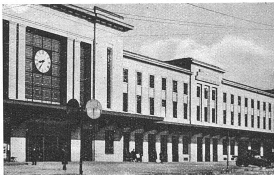
La nouvelle gare de Cornavin