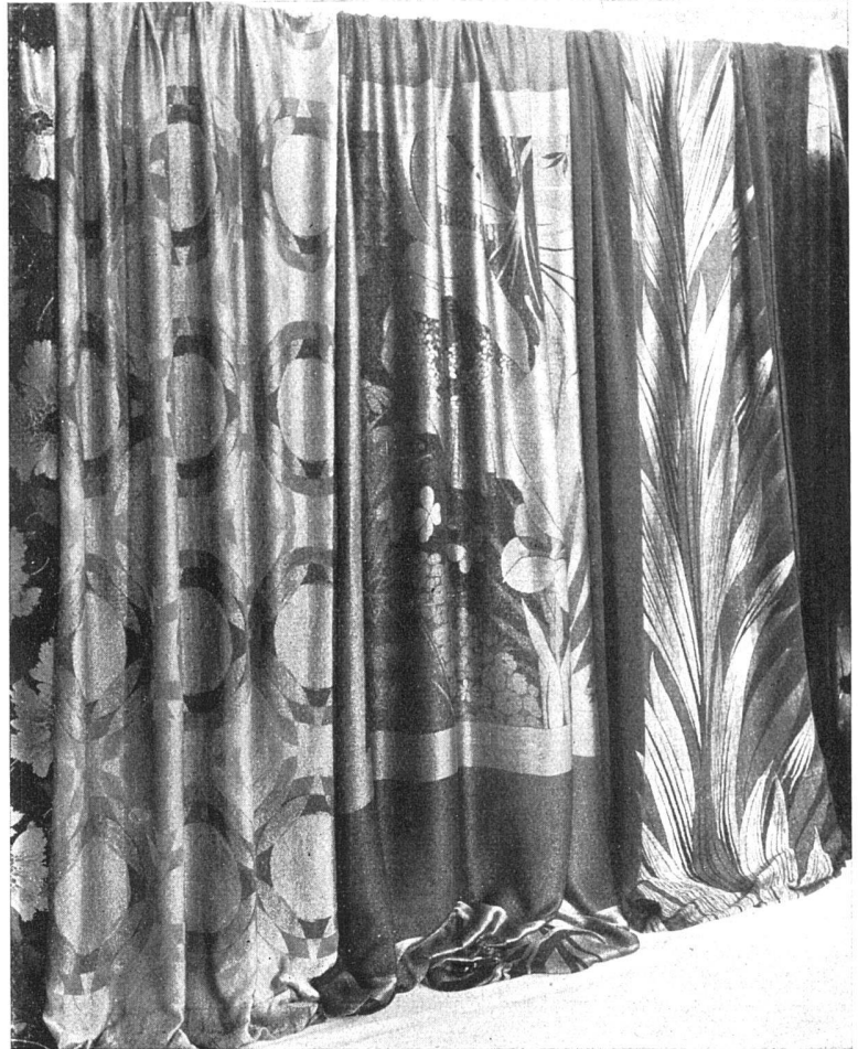
Farbige und Goldstoffe der Firmen Bianchini, Férier; Coudurier, Fructus, Descher; F. Ducharne, Paris

klappen wären: aber dann sperrt es plötzlich, und wenn schon — was hätte man schon davon, wenn es ginge?