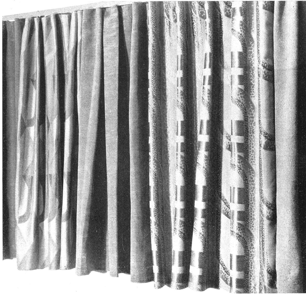
Bespannstoffe der Firma Rodier, Paris in grauen und Kupfertönen

Kulturgetue und expressionistisches Pathos dahinter. Eine Vitrine enthält verschiedene Kunstgläser, vor allem von Maurice Marinot in Troyes. Es gibt vielleicht keinen zweiten, der eine solche fast mystisch-unmittelbare Verbundenheit mit der Substanz des Glasflusses und mit den Techniken seiner Bearbeitung im flüssigen wie erstarrten Zustand hätte. Schlierige, von Blasen durchsetzte und in einer edeln Art naturfarbene oder bunte Gläser sind in wuchtige Formen gegossen und zum Teil offenbar nach dem Erstarren mit einem rotierenden Instrument, das den Bohrmaschinen der Zahnärzte verwandt scheint, bearbeitet worden, sodass glatte Oberflächen mit solchen von matter, drusiger Beschaffenheit abwechseln und höchst reiche unmittelbar aus der Kristallstruktur des Stoffes herausentwickelte Wirkungen ergeben. Sehr schönes Kunstgewerbe in Glas, zum Teil in vorzüglichen «ornamentlosen» Formen, ist unter den Parfümerie-Flacons zu finden, während die eigentlichen Gebrauchsgläser, in denen Frankreich und Belgien Vorzügliches leisten, vielleicht noch reichhaltiger vertreten sein könnten. Zum Besten, was auf dem Gebiet des Gebrauchsgeschirrs zu haben ist, gehören die gelblichen oder sela-