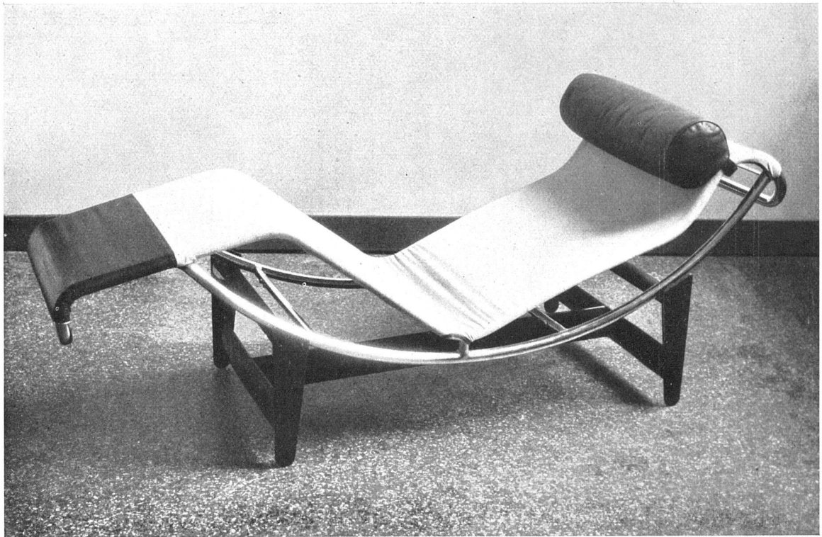
Liegestuhl der Firma Thonet Frère, Paris Modell von Le Corbusier, Pierre Jeanneret und Charlotte Perriand

das sehr hohe Niveau des französischen Druckerhandwerks am allerbesten, worauf es, im Ganzen gesehen, fast noch mehr ankommt als auf die hervorragenden Einzelleistungen ausnahmsweise begabter einzelner Künstler. Hervorragend ist auch die Druckausstattung und das Wechselspiel von Druck und Abbildung der gezeigten Bücher und Geschäftsdrucksachen. Nirgends besser als hier empfindet man den Unsinn des gegenseitigen Ausspielens von Tradition und Modernität. Mit jahrhundertalten Schrifttypen werden hier allermodernste Wirkungen erzielt. Die französischen Typographen finden es offenbar gar nicht nötig, fortgesetzt neue Schrifttypen zu erfinden, wenn man typisierte und genormte Schriften hat, die ihren Zweck so vollkommen erfüllen, dass keine Aenderung ihre Leistung verbessern könnte.