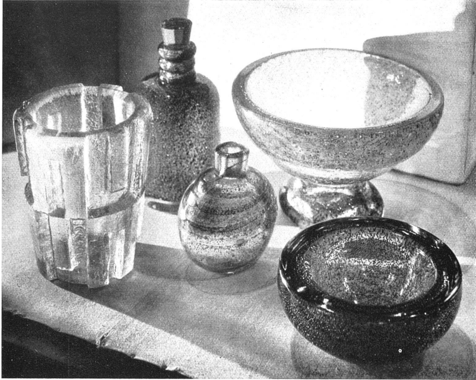
Gläser von Maurice Marinot, Troyes

Französische Ausstellung im Kunstgewerbemuseum Zürich