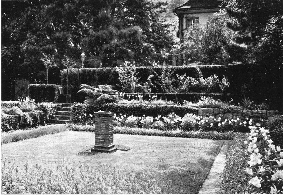
Wohngarten J. Schweizer in Glarus

chitektonisch geformten und absichtlich romantisch wuchernden Partien, sei es durch strenge, aber unaufdringliche Komposition des Ganzen, die dem lebensprühenden Reichtum der Blumen nur zu um so schönerer Geltung verhilft, ohne als Zwang in Erscheinung zu treten. Unser Hausgarten ist die Wohnung im Freien für die Familie, mit Sitzplätzen für alle Tages- und Jahres-