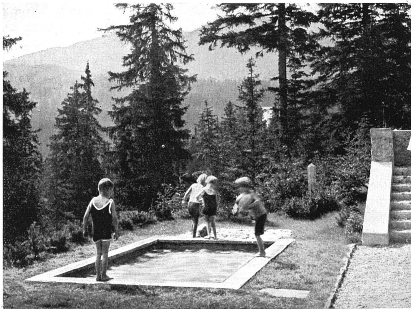
Planschbecken vor einem Haus in Arosa von J. Schweizer, Glarus

J. Schweizer , Gartenbauinspektor, Glarus.