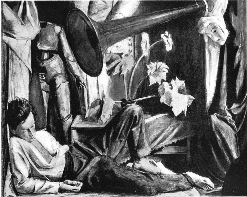
Der Maler, 1928 Museum Bern 175 cm breit