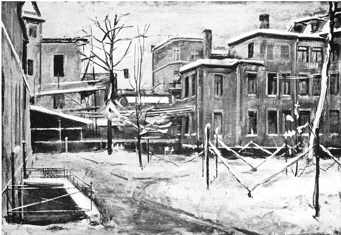
Winterlandschaft, 1928 ca. 105 cm breit