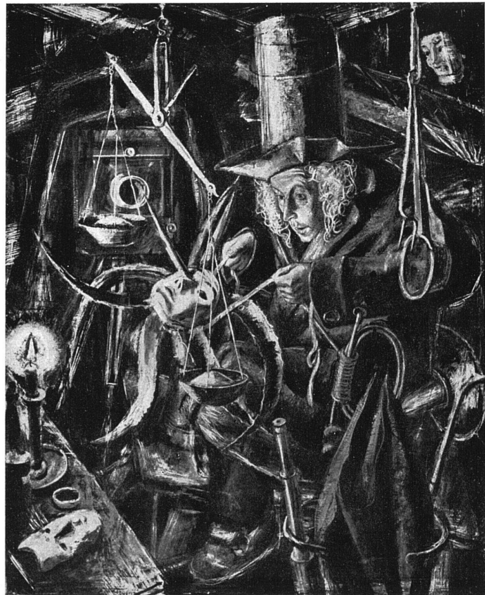
Atelierreiter, 1927 125 cm breit