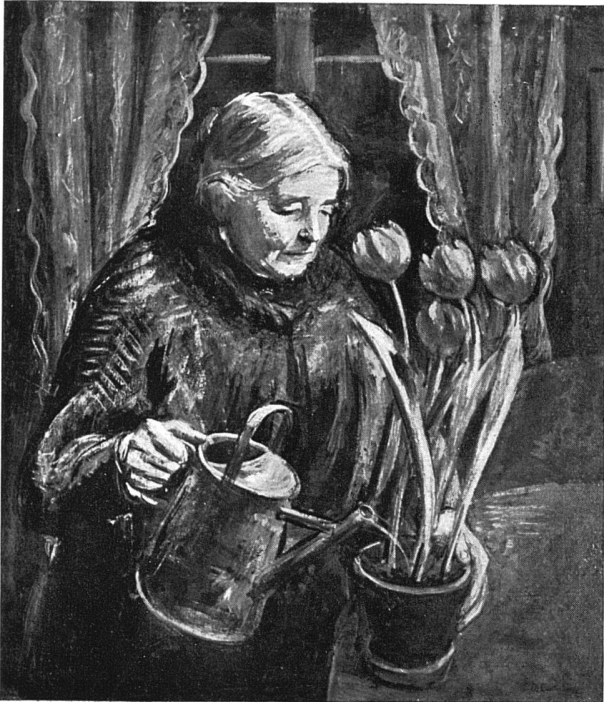
Die Mutter des Künstlers, 1924