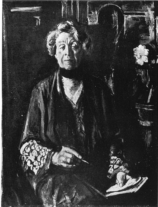
Porträt Ricarda Huch, 1928 115×90 cm