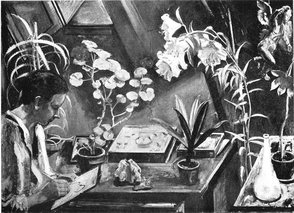
Stilleben mit Selbstporträt, 1927 150 cm breit