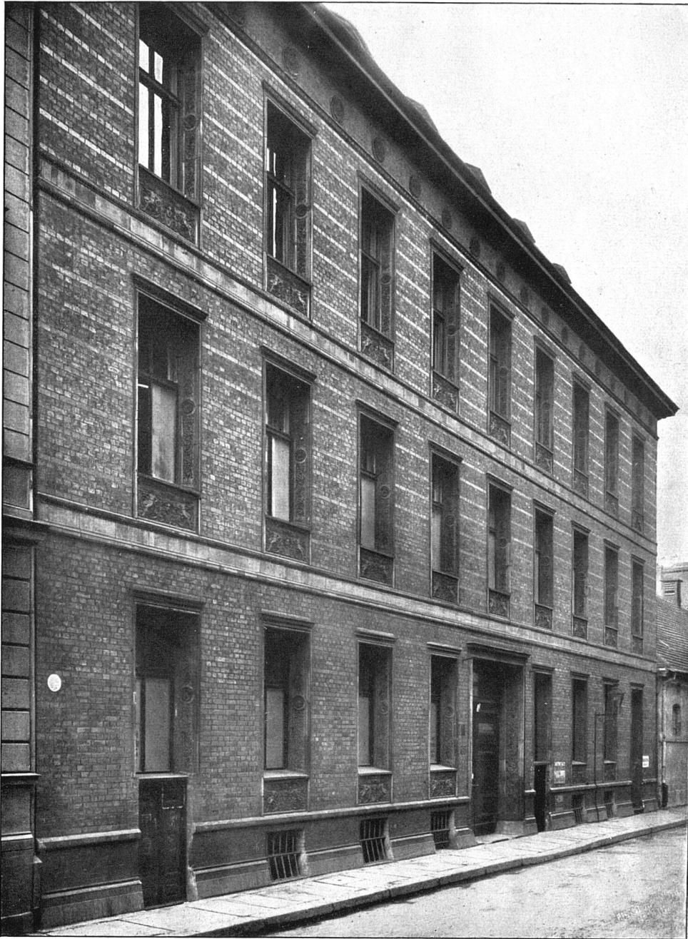
Carl Friedrich Schinkel Feilnersches Wohnhaus, Berlin 1829

Alle Abbildungen stammen aus der Monographie «Carl Friedrich Schinkel» von August Griesebach, Insel-Verlag, Leipzig 1924