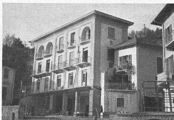
unten: was gleichzeitig am See gebaut werden darf, ohne dass irgend jemand protestiert