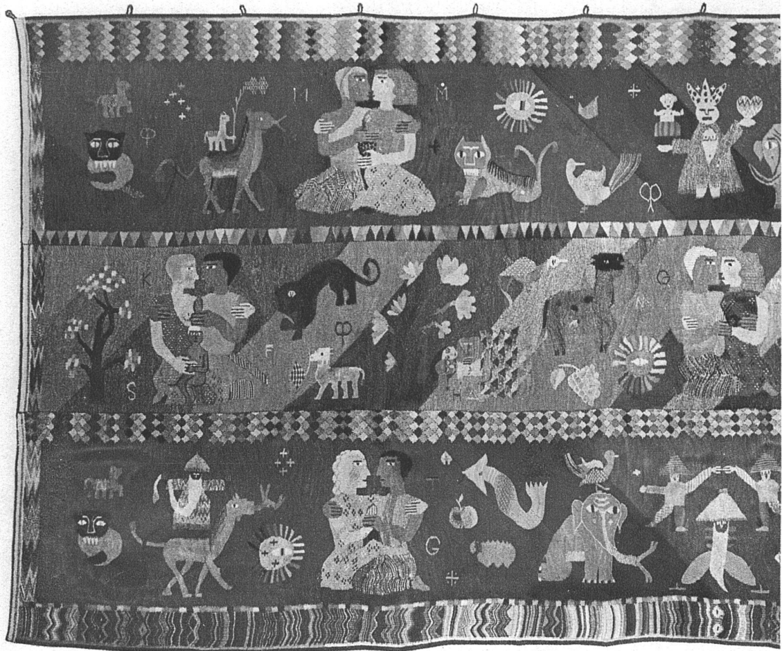
Bildteppich von Maria Geroë S.W.B.

Dieser Wandteppich ist aus Leinen und Seide auf einem Hochwebstuhl (haute lisse) in Gobelintechnik gewoben. Wie jedes Kunsthandwerk muss die Gobelinweberei aus ihren eigenen Elementen geschaffen und betrachtet werden. Ein Wandteppich darf nicht die Wirkung eines Gemäldes erstreben, man muss ihn flächig empfinden, seine Zeichnung soll im Korn, in der Struktur des Gewebes begründet sein, das bei guter Arbeit fest, glänzend und sauber ist. — Der gewirkte Wandteppich bleibt immer ein Einzelstück, er kann ebenso wenig industriell hergestellt werden wie eine Plastik oder ein Bild. Was soll auf einem Wandteppich herge-