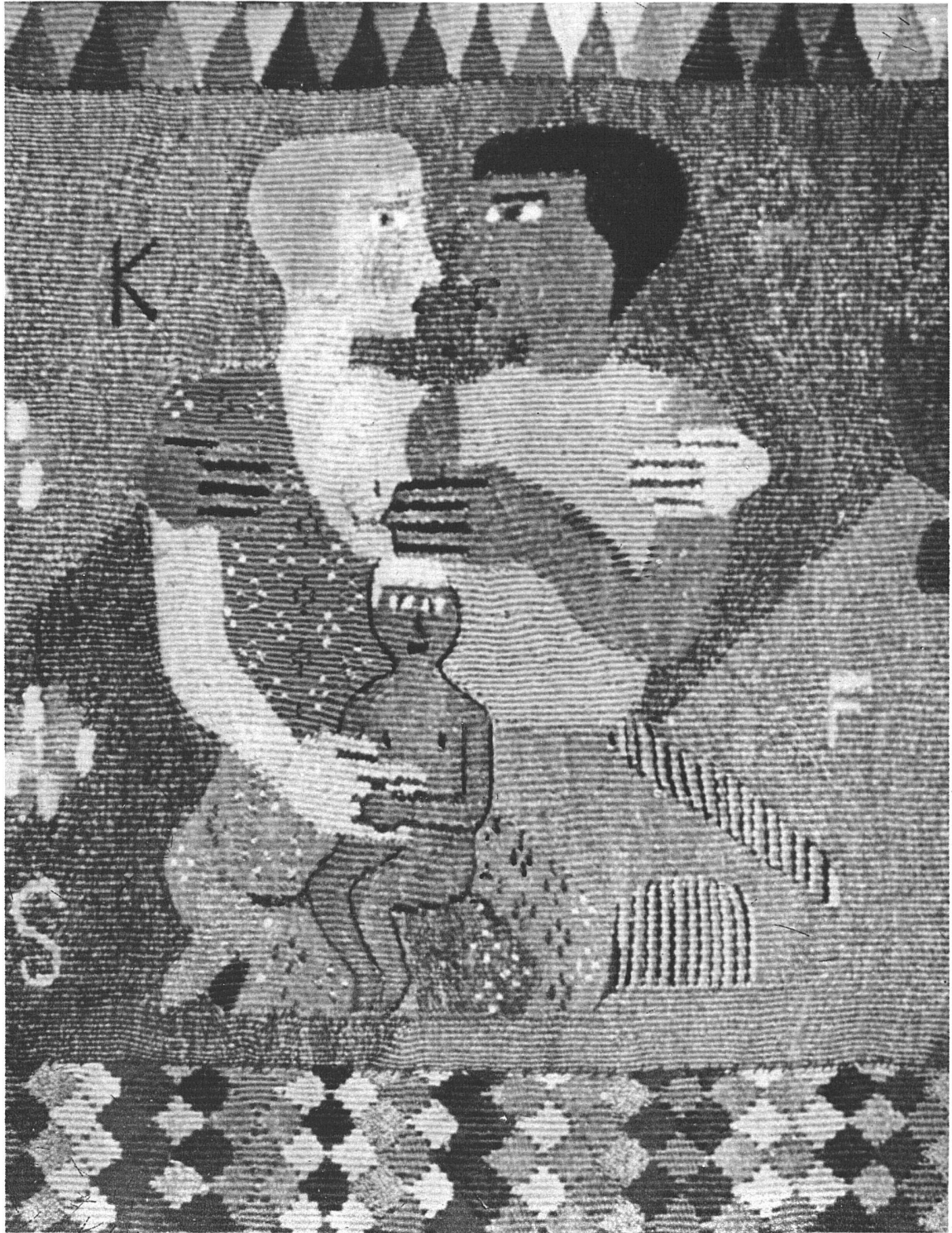
Bildteppich in Gobelinteknik, 100 × 220 cm Maria Geroë S.W.B., Montagnola Leinen und Seide, in drei Streifen gewoben, Grundfarbe der beiden äusseren Streifen gedämpftes Rot, des mittleren blau