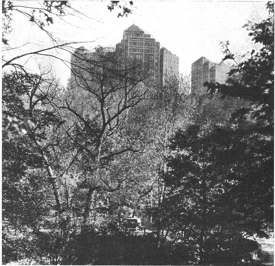
Alden Park Manor Philadelphia Arch. Edwyn Rorke

dren, men and women». Also Wohnungen für Familien einschliesslich Familiensentiments, und von dem Bolschewismus, den ängstliche Gemüter auch hier schon wieder wittern, ist keine Rede. Sonst wären nicht neun Zehntel aller bisher gebauten Appartement-Häuser ausgerechnet in Amerika gebaut worden.