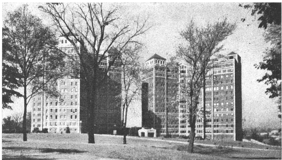
Alden Park Manor Philadelphia Arch. Edwyn Rorke

vermittels Architektur erzogen werden soll, stehen wir im Gegenteil mit ausgesprochener Skepsis gegenüber. Sie dürfte in der Hauptsache ein Blumenopfer sein, niedergelegt auf dem Altar der Modegöttin «Soziologie». Denn in der Praxis wird gerade die absolute Unabhängigkeit geschätzt, die der Bewohner einer großstädtischen Miethauswohnung geniesst, wo man kaum die Mieter nebenan auf dem gleichen Treppenpodest kennt,