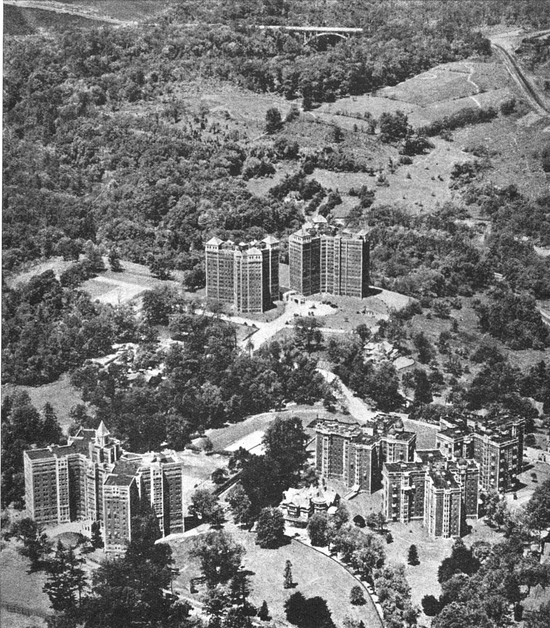
Alden Park, Philadelphia Architekt Edwyn Rorke

Bauten und viele europäische Wohnturmentwürfe vor allem davon ausgehen, möglichst viele Wohnflügel um einen zentralen, die Beförderungsmittel enthaltenden Mittelteil zu gruppieren, wendet Gropius die Grundsätze des Reihenhauses auf den Typus des Hochhauses an. Alle Wohnungen seiner breiten, wenig tiefen Hausblöcke haben gleich gute Sonnenlage im Gegensatz zu den sternförmigen Wohnturmgrundrissen. Wie sich diese beiden Hochhaustypen hinsichtlich der Baukosten zu einander verhalten, wäre erst noch zu berechnen. Prof. Gropius hat dagegen die Berechnungen im Vergleich zu den üblichen viergeschossigen Wohnbauten durchgeführt