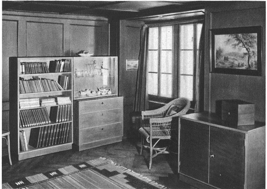
F. Largiadèr, Architekt SWB, Erlenbach-Zürich Kombinierbare Kistenmöbel aus Okumé natur, gewischt. Blatt: Linoleum pompejanischrot Handgewirkter Teppich von Edith Nägeli SWB, Zürich