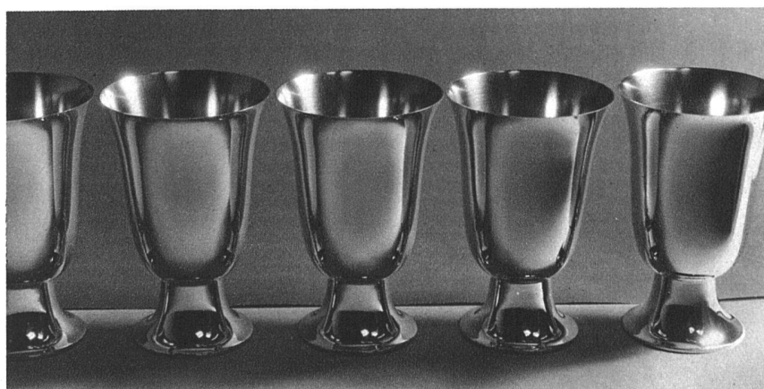
Gobelets für Sportpreise