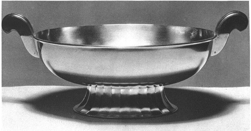
Fruchtschale mit Ebenholzgriffen