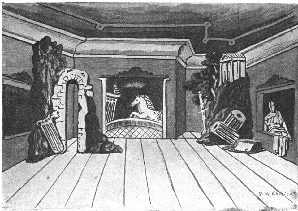
Giorgio de Chirico: «Le Bal» (1929). Sammlung Serge Lifar.