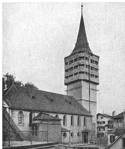
rechts: Kirche St. Peter Zürich

Vertreter in allen grösseren Kantonen • Mietweise Erstellung für Neu- und Umbauten durch