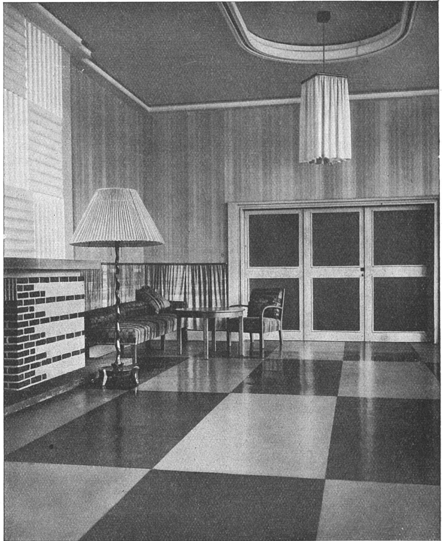
Empfangsraum Bodenbelag: Unilinoleum blau und hellgrau