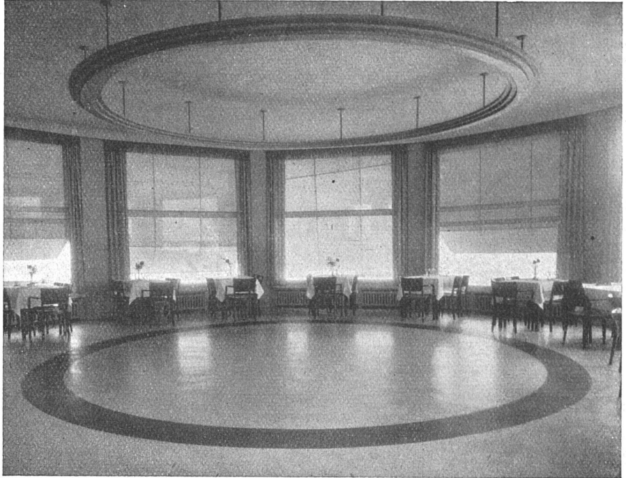
Dancing Bodenbelag: Supershiplinoleum beige und blau

platten. Um von diesem Gang in das durch eine Tür abgeschlossene Treppenhaus zu gelangen, muss daher ein 65 cm breiter Streifen dieses Plattenbodens überschritten werden. An dieser Stelle glitt am 20. Februar 1928 der Gemeindeammann von Ueken, Albert Ackle, der damals genagelte Stiefel trug, aus und stürzte zu Boden, wobei er sich einen Oberschenkel brach.»