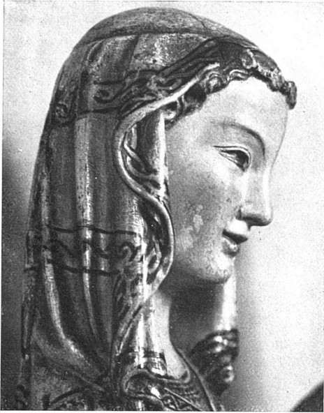
oben: Die Madonna der Heimsuchungsgruppe von St. Katharinenthal bei Diessenhofen, im Profil