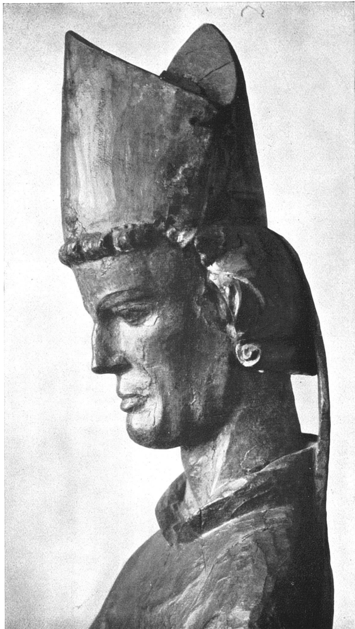
Kopf eines thronenden Bischofs aus Adetwil (Luzern) 142 cm hoch Landesmuseum Zürich etwa 1300–1330

Alle Abbildungen aus: Gotische Bildwerke der deutschen Schweiz 1220–1440 von Ilse Futterer , Quart, 206 Seiten Text, 96 Tafeln mit 313 Abb. Dr. Benno Filser Verlag, Augsburg 1930. Geb. Fr. 48.75.