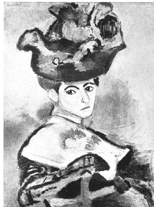
Henri-Matisse Femme au chapeau, 1905

Das hat Matisse getan. Anfänglich wirkte er mit seiner knappen Ausdrucksweise in Linie und Farbe umstürzlerisch und galt um 1906 als das Haupt der revolutionären Malergruppe «Les Fauves», zu der seine Freunde Derain, Vlaminck, Friesz, Dufy, Marquet, van Dongen u. a. gehörten, Maler, deren künstlerische Beziehung zu dem Führer Matisse meist heute noch offensichtlich ist. Sie kämpften um eine neue Malform in breiten hellen Farbflecken und dick konturierten, derben Figuren, eine wesentlich andere Ausdrucksweise als etwa die von Vuillard und Bonnard, die das Erbe der Impressionisten mit aller Delikatesse und verfeinerten Kultur pflegten. Die Fauves und vor allem Matisse zogen Künstler aus allen Ländern in ihren Bannkreis, so die Deutschen Purrmann, Levy und Matisse' treuesten Schüler Oskar Moll, die Ungarn Bereny und Czobel, ferner Russen, Norweger und Schweden. 1908