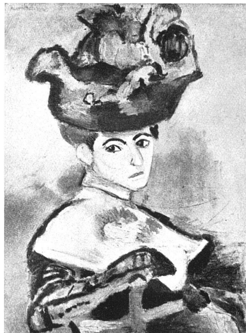
Henri-Matisse Femme au chapeau, 1905