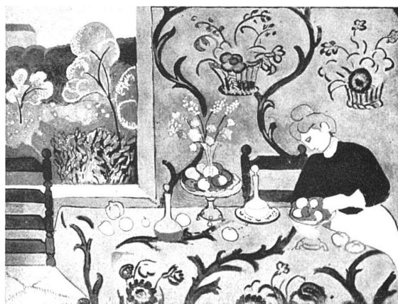
Henri-Matisse La desserte, 1909