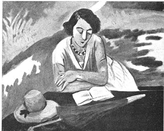
unten: Intérieur aux myosotis 1916