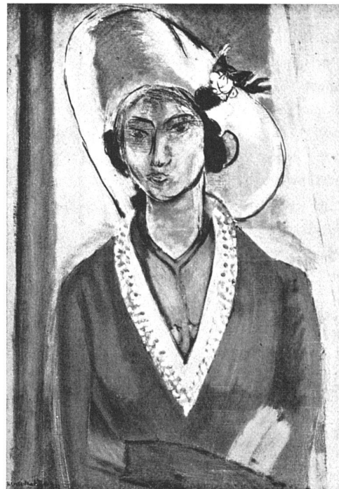
Henri-Matisse Femme au chapeau, 1929

Die Formen sind, um ihnen möglichst geschlossene Wirkung zu wahren, durch dunkle Konturen gegeneinander abgegrenzt, die Farben nicht ineinander verstrichen, sondern als einzelne Töne neben- und übereinander gesetzt. Matisse belebt eine Wand durch andere Mittel als impressionistische Tonigkeit, er überzieht sie tapetenartig mit einem gleichförmigen, fließend aufgestrichenen Muster und löst sie so in einen dekorativen