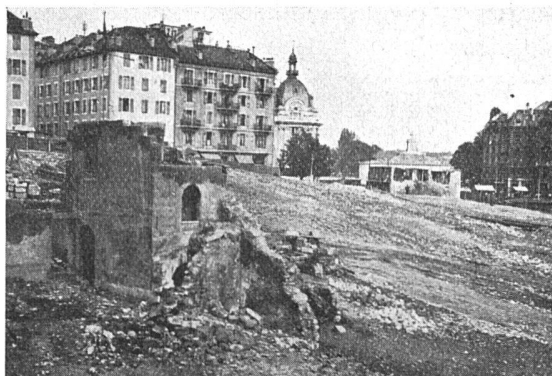
Fin des démolitions du Quai du Seujet, Genève