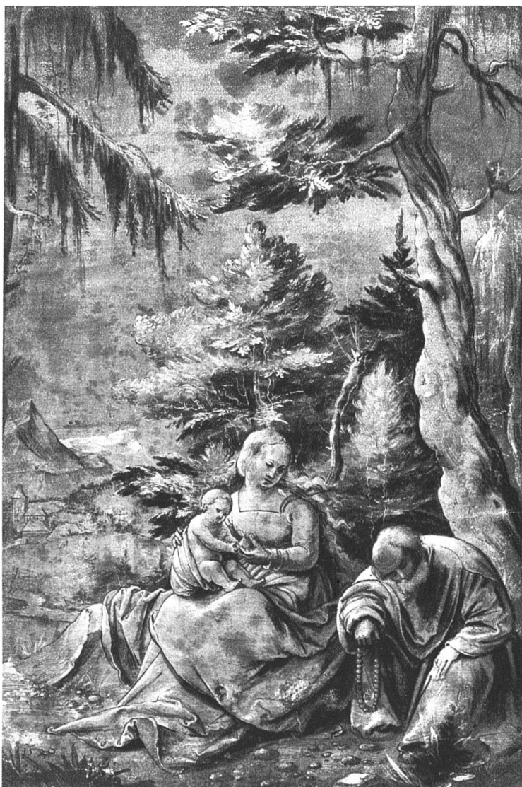
Ruhe auf der Flucht nach Aegypten, Feder, weiss gehöht auf violettem Grund 1520, Sammlung Königs, Haarlem, 299 × 200 mm

Eine zarte Leinwand, die erste vielleicht, auf die in unseren Landen gemalt wurde, dünn, stellenweise zerrieben, stellenweise unvollendet und doch eines der unvergesslichsten Kunstwerke, das je in unseren Grenzen geschaffen wurde. Um dieses kindlich reinen, kindlich ungeschickten und kindlich bezaubernden Werkes willen schon kann man seinen Schöpfer neben den mehr zeitillustrierenden Kollegen nicht übersehen. Weil die besten Leistungen des Hans Leu einfach, stark und selbständig empfunden und gestaltet sind, bleiben sie gegenwärtig, bilden sie noch jetzt ein Entzücken und dürfen wir auch an dieser Stelle, wo kein Anlass zu lediglich antiquarischen Jubiläen ist, ihres Urhebers gedenken.