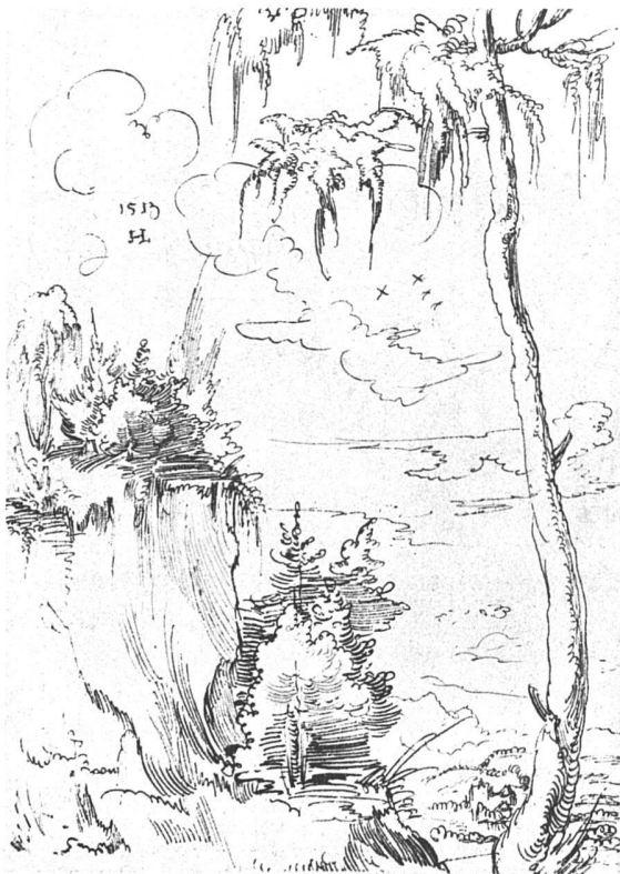
Landschaft, Federzeichnung, 1513 Kunsthau Zürich, 185 × 132 mm

Es gibt ein Klischee von alter Schweizer Kunst: Landsknechte in zerschlitzten Gewändern, keckem Federbarett, mit drohenden Waffen, abenteuerlich und wild, oder prahlerische Wappen mit schildhaltenden Frauen in üppiger Marketenderinnentracht. Diese einseitige Vorstellung von der Kunst unserer Vorfahren, die wahrlich eine ganz andere Breite und Tiefe hatte und zartere Reize zu bieten vermag, ist schuld an viel ärgerlichem Umfug. Man berauschte sich an solchen Repräsentanten einer heroischen Vergangenheit, und so entstand während der Herrschaft des Jugendstils die Mode des Patriotisch-Altertümlichen: man baute Häuser wie Burgen und bemalte Fassaden mit fahnenschwingenden Helden. Man sprach von der Wiedergeburt einer nationalen Kunst, und selbst Hodler hat dieser Gesinnung seinen Tribut nicht entziehen können.