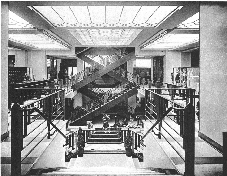
Schaufenster und Verkaufsraum des Damen-Modegeschäftes Robert Lely am Blvd. Haussman, Paris Architekt P. Patout, Paris Schaufenster in Metall gefasst, Abschlussleisten und Sockel aus weissem, schwarzgeädertem Marmor; breiter Rahmen aus Mattglasplatten mit Marmoreinfassung oben und seitlich Namenkartusche Metall und Mattglas, von innen beleuchtet