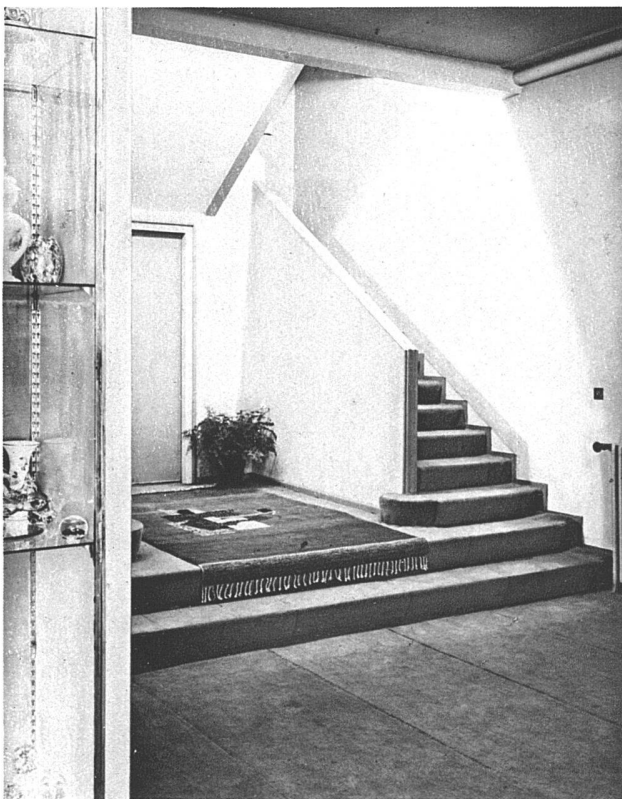
Modesalon Myrbor, Paris Architekt André Lurçat, Paris