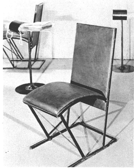
Büchergestell aus Nussbaum poliert und Metall, Sofa und Stühle Metall und blaues Leder. Metalltischchen mit anmontierter Beleuchtung

Diese stark «blecherne» Einrichtung ist gewiss nicht als Sachlichkeit ernst gemeint, sympathisch ist ihre Harmlosigkeit, sie ist bewusst spielerisch-modern, ohne das Modernitätspathos so vieler anderer Metallmöbel. Dieses Informationsbureau über Theaterveranstaltungen hat selber etwas von einer Bühnenausstattung. pm.