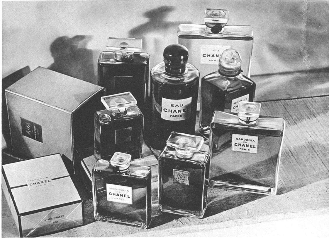
Französische Parfumerie-Flacons und -Packungen