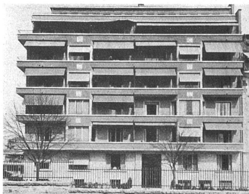
Maisons locatives, M. Pittard, architecte, à Sécheron, Genève

bientôt une année et ceux de la Salle des assemblées près de la terminaison du gros œuvre, a provoqué une certaine activité dans la construction des quartiers environnants. Nous montrons ci-dessous deux types de maisons de rapport à Sécheron. Ces bâtiments de 7 à 8 étages possèdent bien les caractéristiques de ce genre de constructions, de