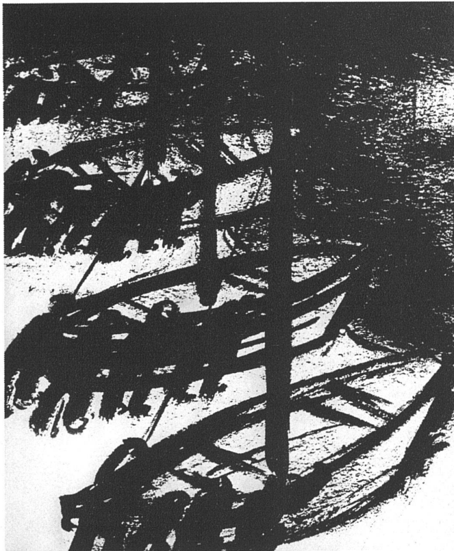
«Hinausschieben der Boote»

«Wenn man die saubere Ordnung im Staate, im Menschen selbst will, dann ergibt sich auch für den Künstler die Stellungnahme zu den Gegenständen. Wir bemühen uns aus einer Zeit herauszukommen, wo eine Landschaft oder ein Mensch nur der Fechtboden für einen Streit allzuallgemeiner und doch individualistischer Gefühle wird.»