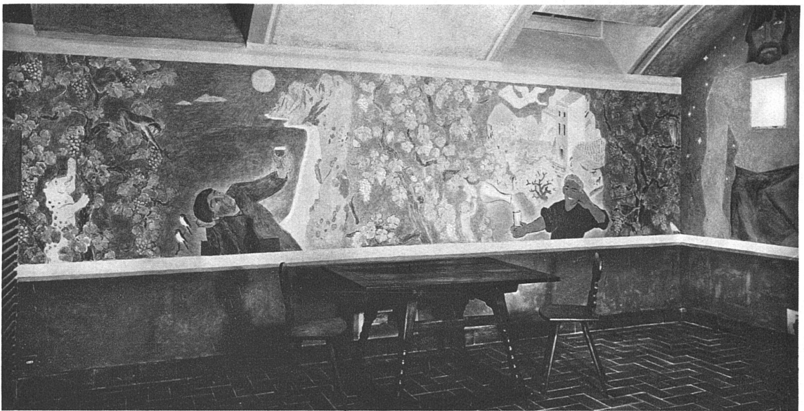
Stirnseite mit Eingang