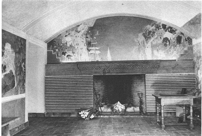
Stirnseite mit Kamin