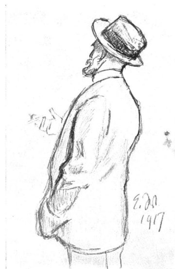
Ernst Würtenberger Selbstporträt Zeichnung

«In der Kunst besteht eine geheimnisvolle Beziehung zwischen Stoff und Form, und zwar in dem Sinne, dass bestimmte Stoffe einer ganz bestimmten Form der Darstellung entsprechen.»