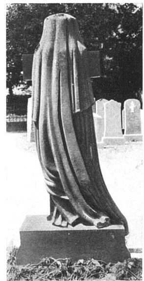
Die trauernde Witwe von hinten — und von vorn! Die Sucht, um jeden Preis originell zu sein, hat manchmal eine unfreiwillige Komik zur Folge, die hier nicht ganz am Platz ist