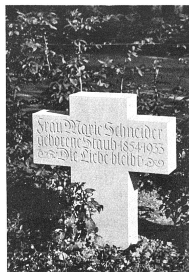
Grabsteine aus der Werkstatt für Grabmalkunst Max Pfänder, Bildhauer SWB, St. Gallen

für ein kleines Kind, das die Stimmung, in der es gestiftet ist, vollkommen rein ausspricht. Ist es nicht ein unnötiger und gefährlicher Bildungshochmut, wenn man von irgendeinem abstrakten Geschmacksideal aus derartiges als Geschmacklosigkeit anprangert — in dem sich gerade die letzten lebendigen Reste eines Volksgeschmacks und wirklich empfundener Symbolik aussprechen?