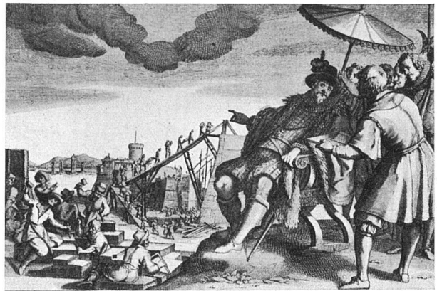
Der Fürst und seine Architekten Der Grossherzog von Toscana, Ferdinand I von Medici, lässt Livorno befestigen. Kupferstich von Jacques Callot, 1592—1635

Die Erneuerung kam nicht aus dem Beruf selbst, sondern von aussen, von seiten gebildeter und kunstempfänglicher Laien, die die englische Reformbewegung von Morris und Ruskin auf den Kontinent übertrugen. Es waren vielfach Maler, die von der Malerei zum Kunstgewerbe und vom Kunstgewerbe zur Architektur kamen, und die kurz vor der Jahrhundertwende einen neuen Architektentypus schufen, der sich bewusst gegen die Auswüchse des spekulativen Baubetriebes wehrte. Die Qualität des Handwerks und der historischen Bauten wird