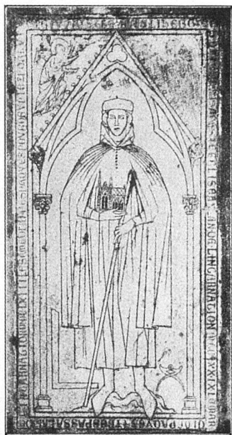
Grabplatte des Architekten Hugues Libergier in der Kathedrale von Reims (nach R. de Lasteyrie «L'Architecture religieuse en France à l'époque gothique, tome II, Paris 1927