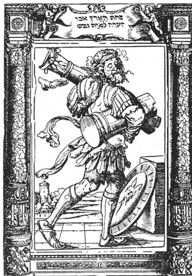
Simson, Patron der modernen Architektur — er räumt mit den Stilformen auf (Holzschnitt des Virgil Solis, um 1515—1562, nach Max Geisberg: «Der deutsche Einblattholzchnitt in der ersten Hälfte des XVI. Jahrhunderts», München 1930)