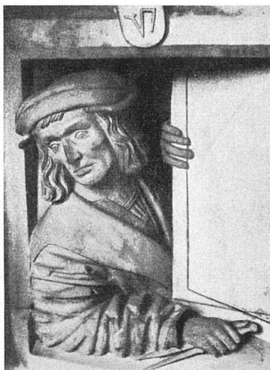
Meister Anton Pilgram Selbstbildnis am Stephansdom zu Wien