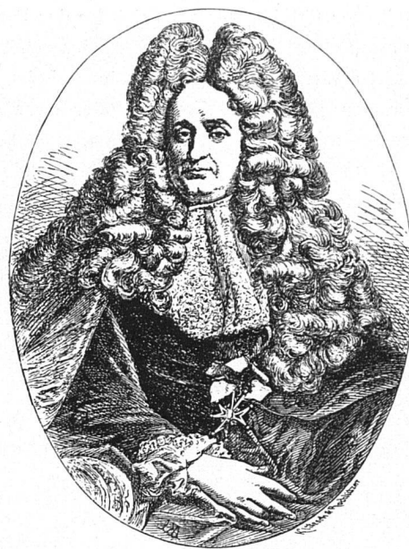
Jules Hardouin-Mansart, 1646—1708