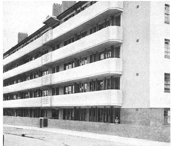
Modernes Aussenganghaus in White Chapel, London. Bowley Street darunter typisches Reihenhäuser in White Chapel

In den Quartieren ganz draussen, am heutigen Rand der Stadt, da freilich das gewohnte englische Bild: das kleine Haus als Norm. Sollte die Forderung, dies Haus nun bloss noch in Gruppen, zu viert, höchst zu sechst zuzulassen, an Stelle der langen Reihen, sollte diese Forderung eine Ueberspannung der Aufgabe bedeuten?