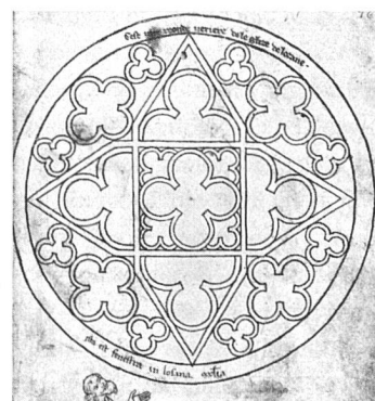
«cest une reonde ueriere de leglise de lozane» «ista est fenestra in losana ecclesia»

Die Rose im Querhaus der Kathedrale von Lausanne