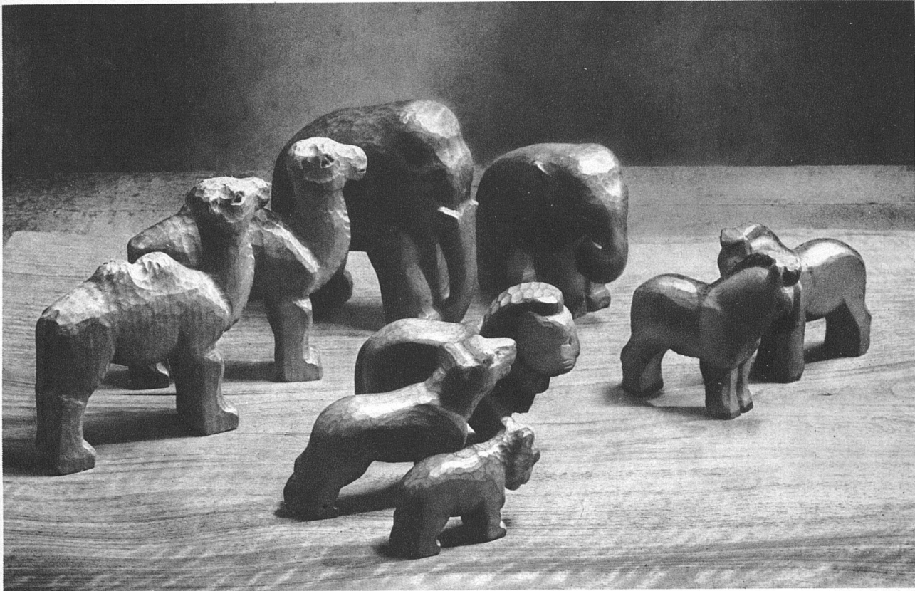
Margrit Bay, Beatenberg (Kt. Bern). Holzgeschnittene Tiere einer grossen «Arche Noah»