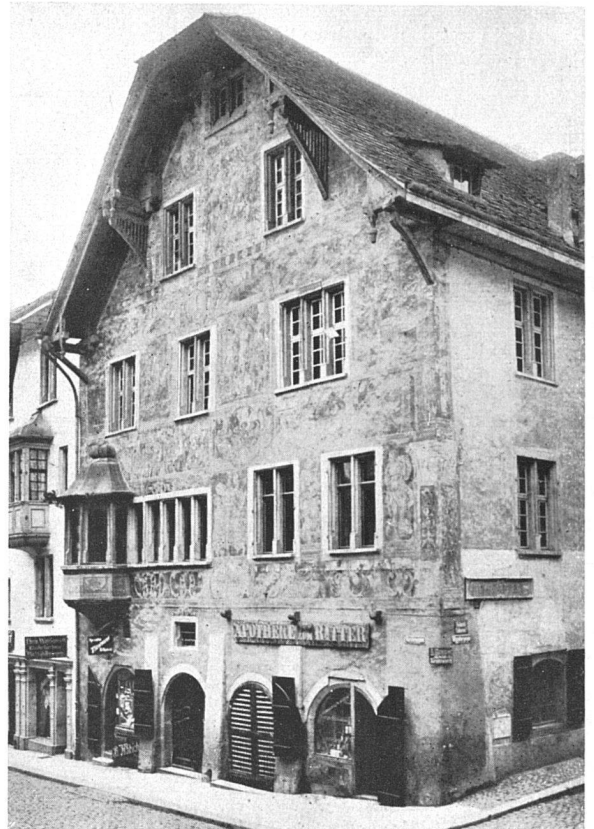
Zustand vor der Renovation von 1919 Der heutige Zustand ist noch wesentlich schlechter

Die Wandfüllungen von Henri Bischoff führen in das Grenzgebiet zwischen Tafelbild und Wandgemälde. Statt