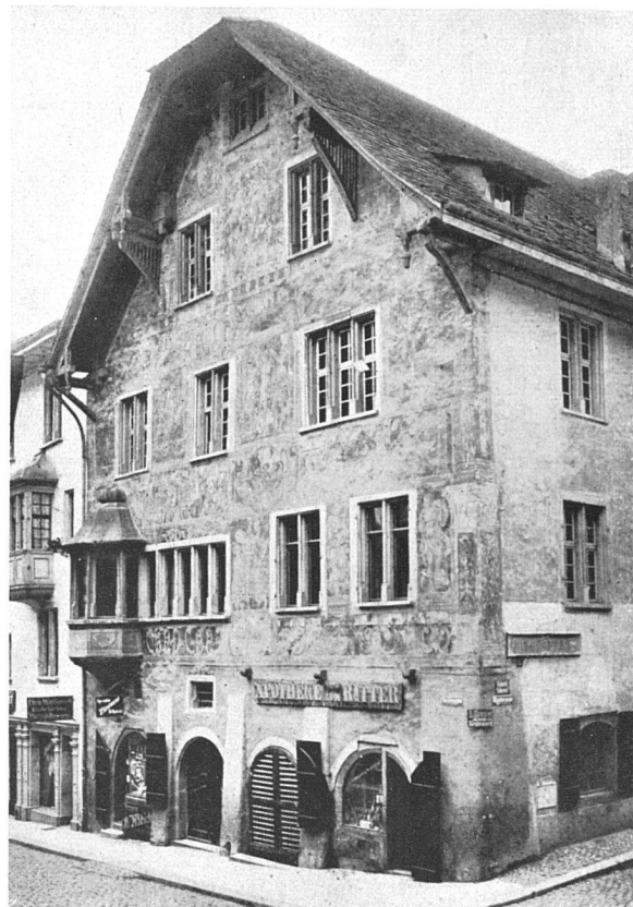
Zustand vor der Renovation von 1919 Der heutige Zustand ist noch wesentlich schlechter

Die Wandfüllungen von Henri Bischoff führen in das Grenzgebiet zwischen Tafelbild und Wandgemälde. Statt